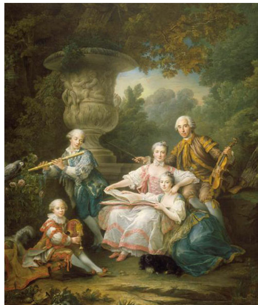
Louis du Bouchet et sa famille, par Drouais

Du Bouchet de Sourches : « Écartelé aux 1 et 4 ; d'argent à deux fasces de sable, qui est du Bouchet; aux 2 et 3 : d'azur semé de fleurs de lys d'argent, accompagné d'un lion de même, qui est Chambes de Montsoreau »