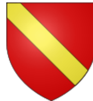
Château de Charnizay (Indre-et-Loire)

En Perche, en Touraine, puis en Nivernais : « de gueules à la bande d'or »