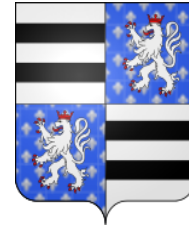
Château de Montsoreau

Du Bouchet de Sourches : « Écartelé aux 1 et 4 ; d'argent à deux fasces de sable, qui est du Bouchet; aux 2 et 3 : d'azur semé de fleurs de lys d'argent, accompagné d'un lion de même, qui est Chambes de Montsoreau »