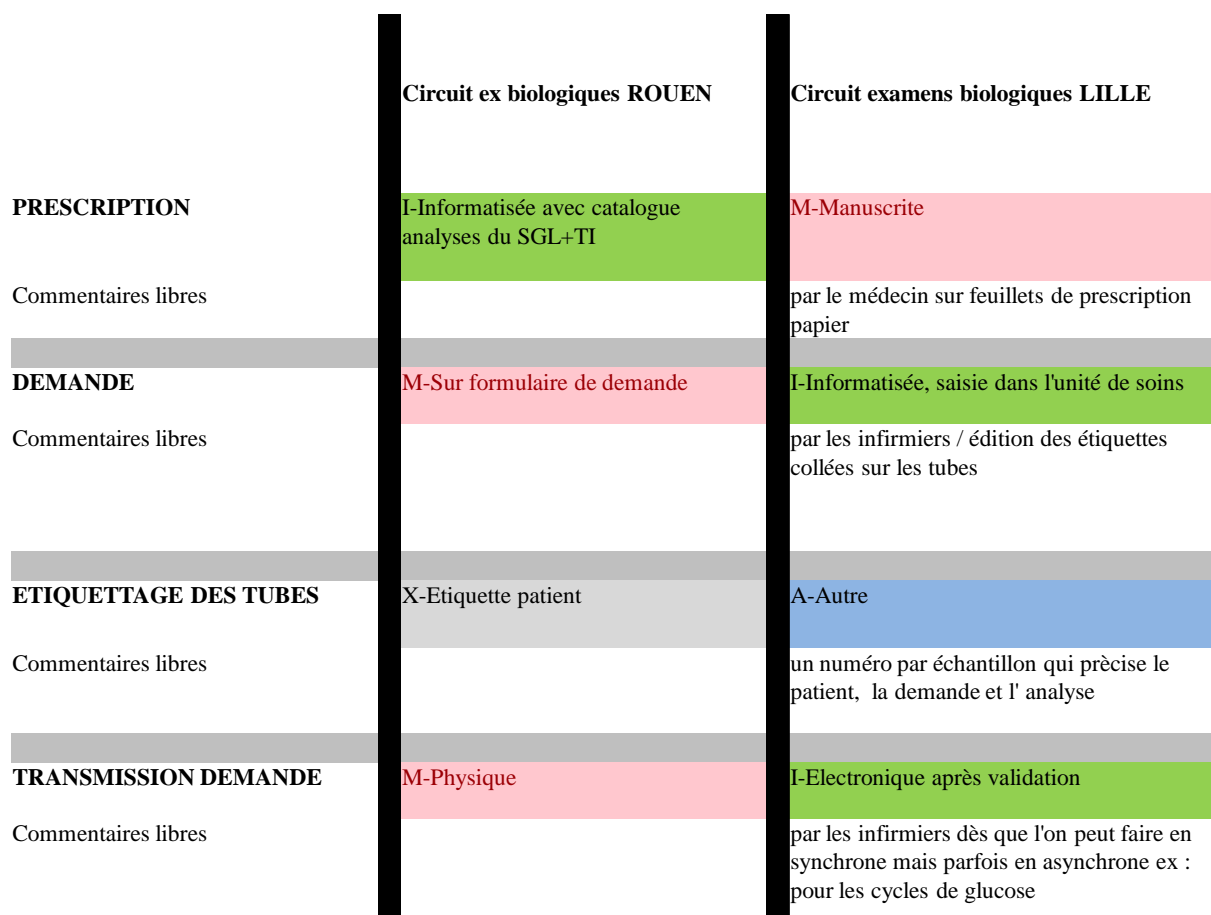
Figure 2 : Cartographie (partielle) du circuit de biologie aux CHU de Rouen et de Lille.