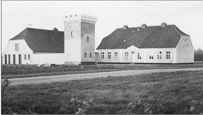
Hovedbygningen til Kongenshus i 1913.

retur, og det var derfor på tide at forberede denne sag, idet der var enighed om, at et sådant minde måtte knyttes til fredning af et karakteristisk hedearreal af dimensioner, så det blev et virkeligt minde om heden med dens vidsyn og fred, dens flora og fauna og et udtryk for, hvorledes store dele af Jylland op rindelig har set ud, hvorledes grundlaget for hedebondens arbejde har været, og hvilket øde det var, der nu er for vundet til produktiv jord.