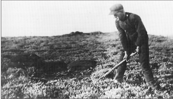
Skæring af lyngtørv til brændsel.