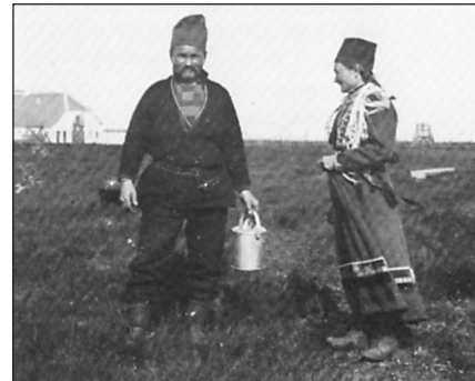
Lappefamilien der passede renerne.

Et par kilometer syd for Kongenshus-bygningen er der rejst en stråttækt kiosk, hvor der løses billetter og forhandles brochurer og forfriskninger. Her findes parkeringsplads og toiletter. Fra kiosken fører en sti gennem en kilometerlang slugt ned mod Resen Bæk. I denne slugts sydside er anbragt en sten for hvert af