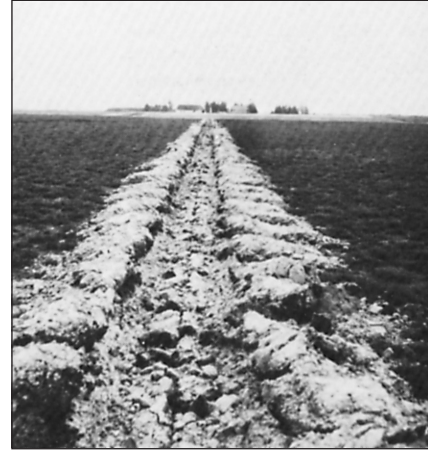
Hedeplojning til plantning.

Ved hedens kultivering er der løst en opgave, som både kulturelt og produktionsmæssigt er af overordentlig række vidde. Danmark er virkelig derved blevet større og rigere. Opgavens