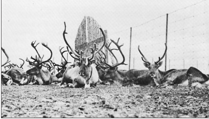
Kongenshus som renpark.

1945 kunne der rigtig tages fat på opgaven. Ved en folkefest den 10. juni 1953 blev Mindeparken indviet i overværelse af kongeparret.