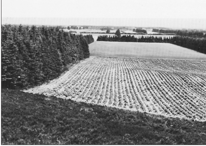
Hedeopdyrkning i nyere tid.

løsning har ikke været let. Kampen mod lyngen, alen og vestenvinden har gennem slægtled været hård og stillet store krav til mod og udholdenhed, men den jyske hedebonde gav ikke op. Hans sejhed, flid og nøjsomhed overvandt vanskelig hederne.