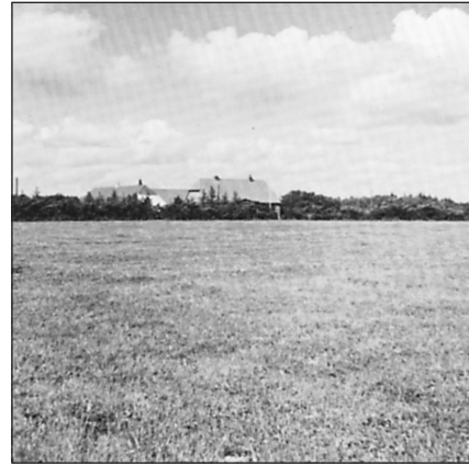
Nyere hedeejendom i Frederiks.