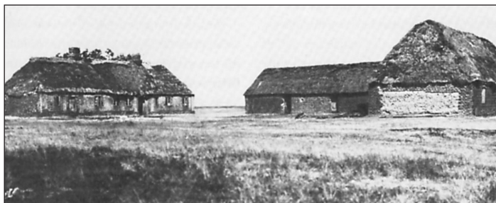
Gammel hedegård fra 1860.

Den egentlige hede havde således en størrelse af 135.000 ha, men også efter 1953 fandt der en ret betydelig opdyrkning sted