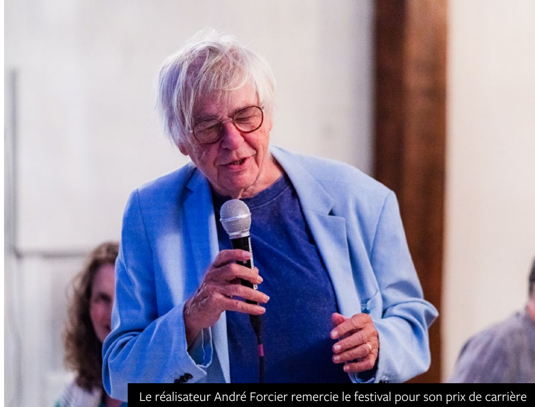
Le réalisateur André Forcier remercie le festival pour son prix de carrière