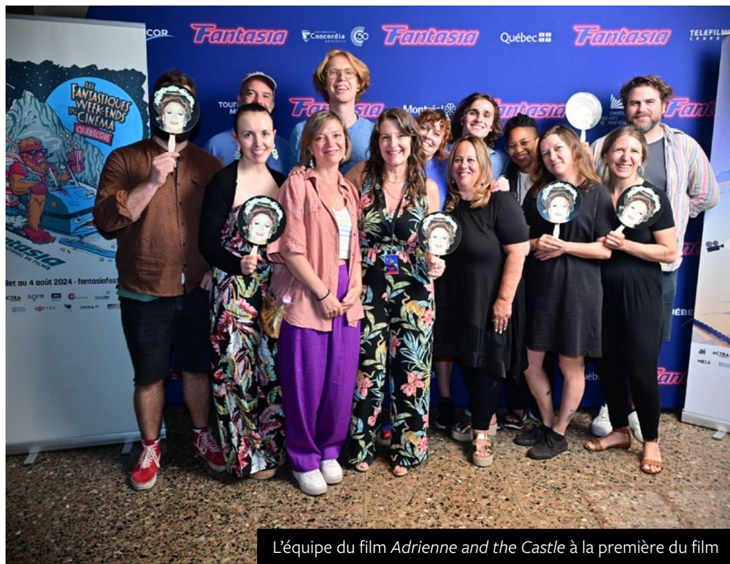
L'équipe du film Adrienne and the Castle à la première du film