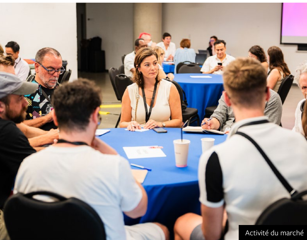
Activité du marché