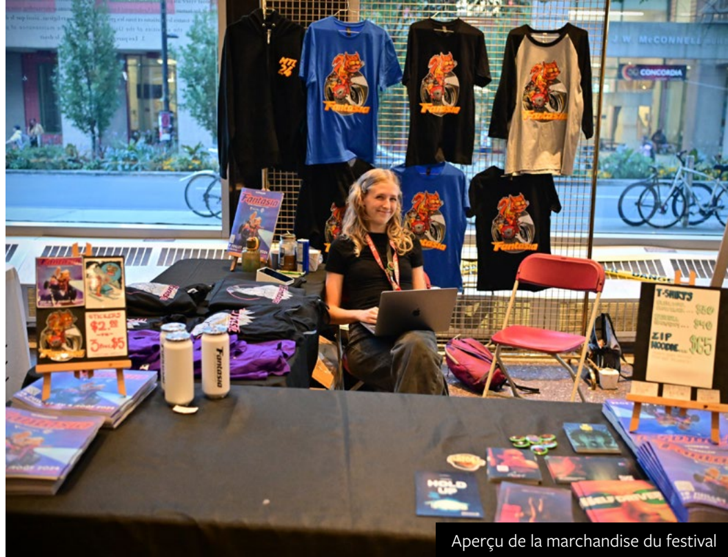
Aperçu de la marchandise du festival