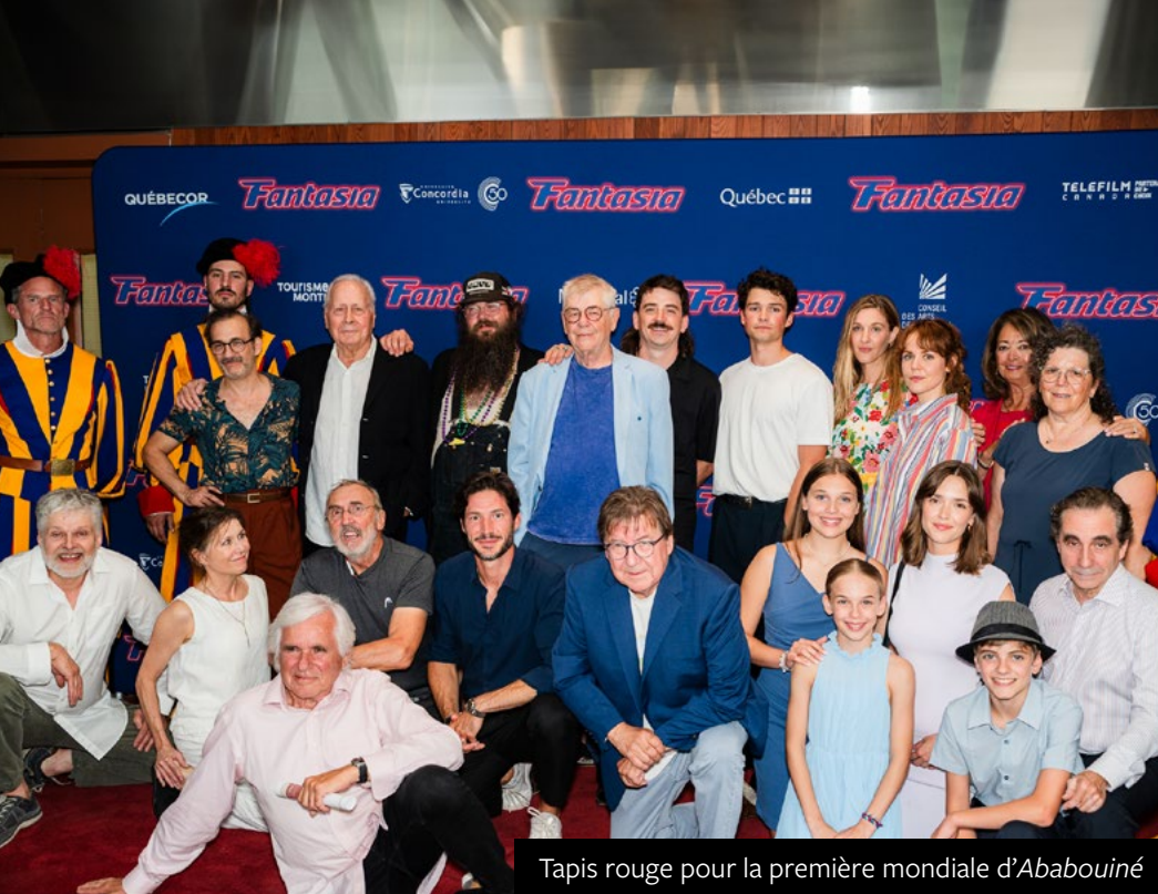
Tapis rouge pour la première mondiale d'Ababouiné