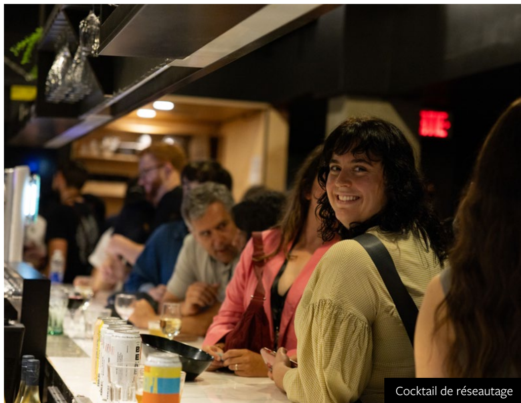
Cocktail de réseautage