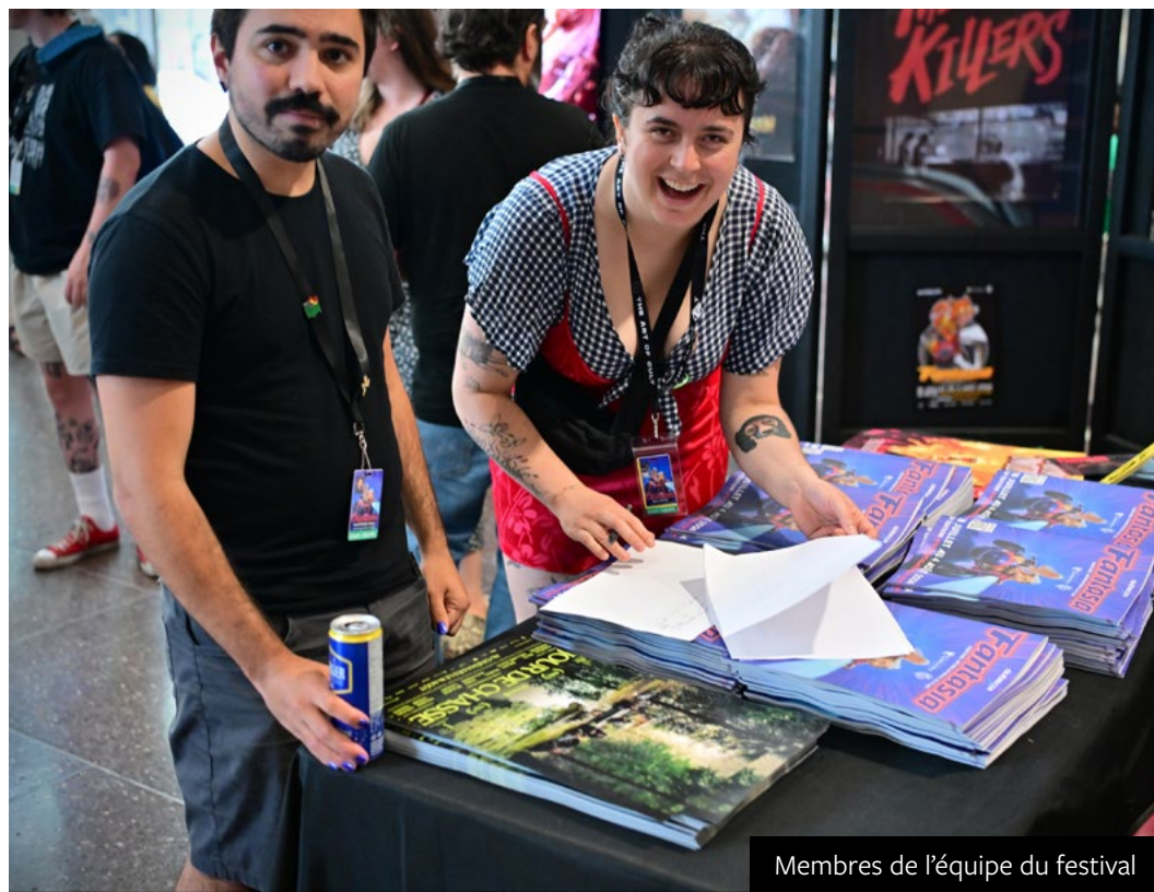
Membres de l'équipe du festival