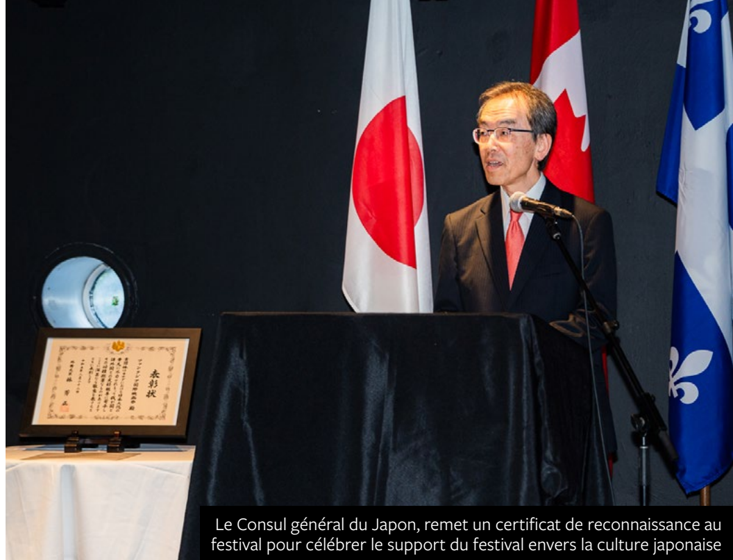
Le Consul général du Japon, remet un certificat de reconnaissance au festival pour célébrer le support du festival envers la culture japonaise