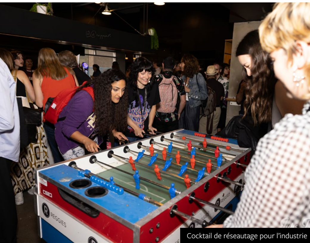
Cocktail de réseautage pour l'industrie