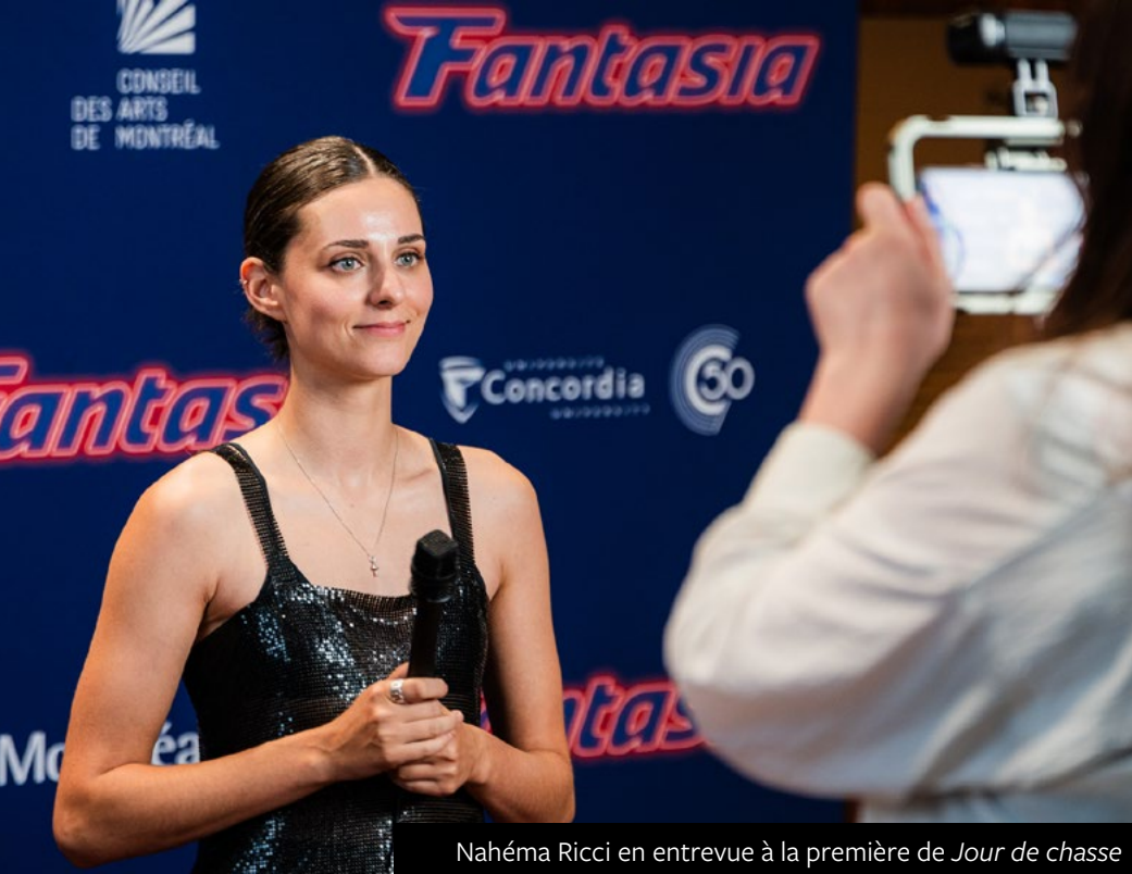
Nahéma Ricci en entrevue à la première de Jour de chasse