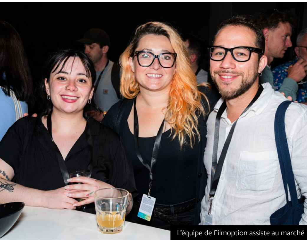
L'équipe de Filmoption assiste au marché