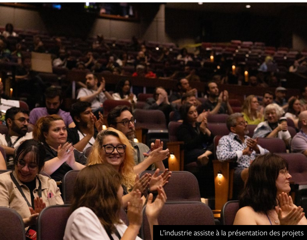
L'industrie assiste à la présentation des projets