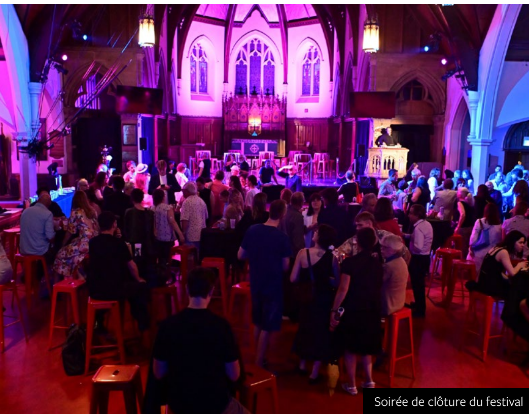
Soirée de clôture du festival