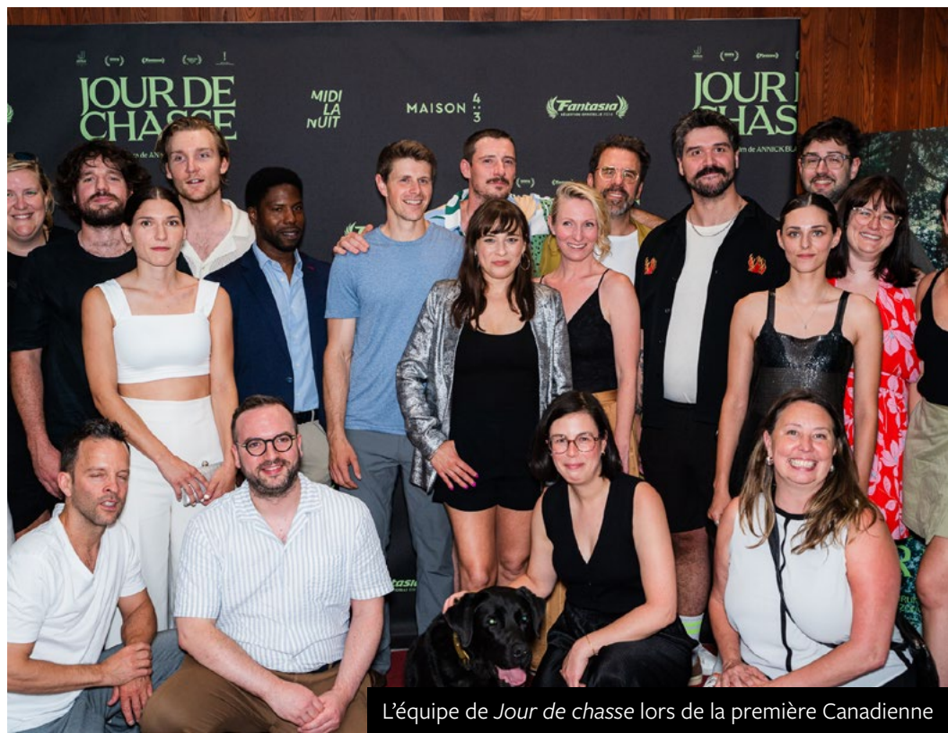
L'équipe de Jour de chasse lors de la première Canadienne