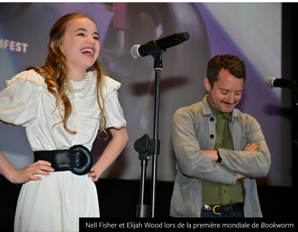
Nell Fisher et Elijah Wood lors de la première mondiale de Bookworm