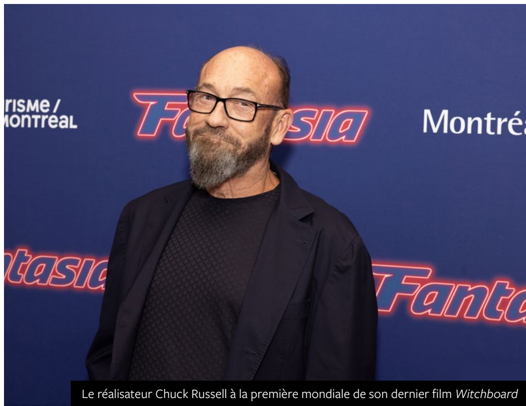
Le réalisateur Chuck Russell à la première mondiale de son dernier film Witchboard