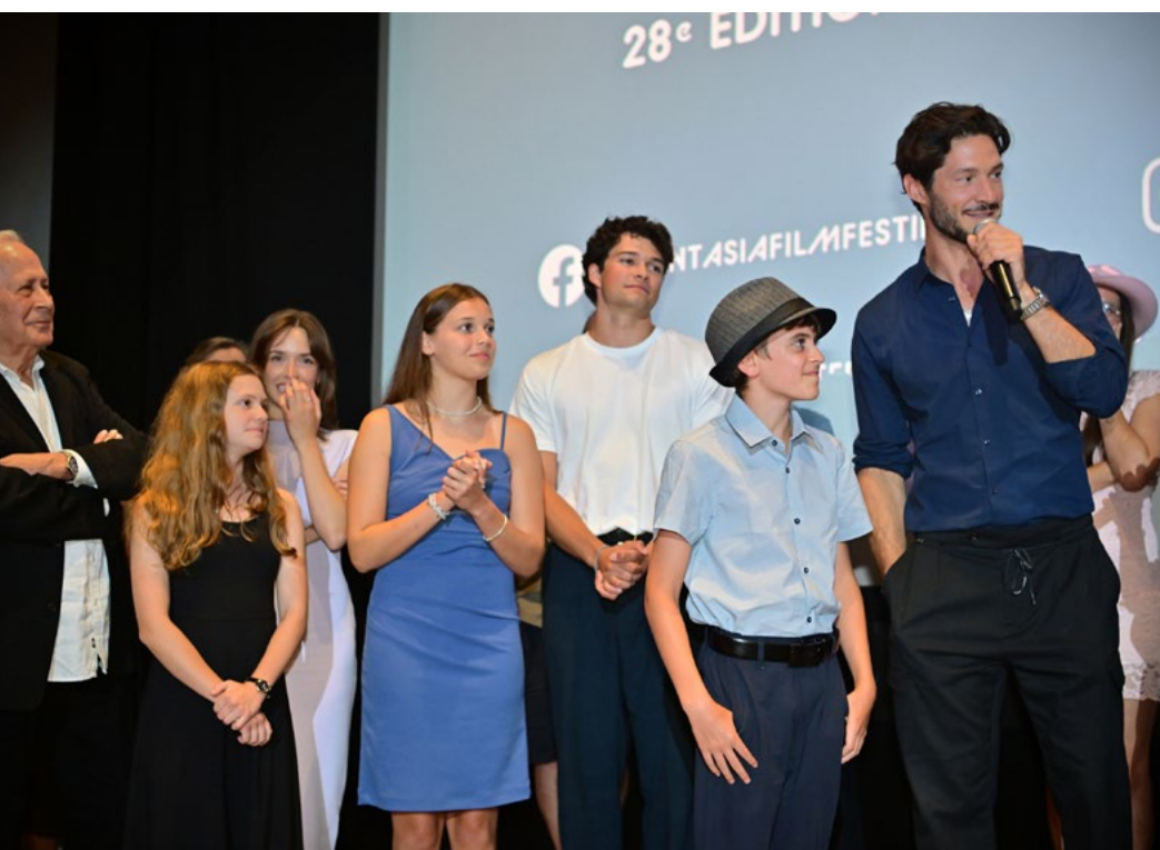
Les acteurs du film Ababouiné lors de la séance de question suite au film