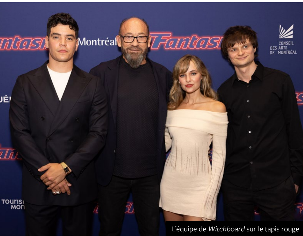
L'équipe de Witchboard sur le tapis rouge