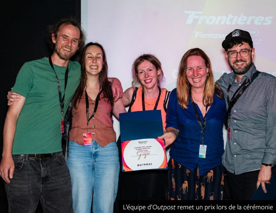
L'équipe d'Outpost remet un prix lors de la cérémonie