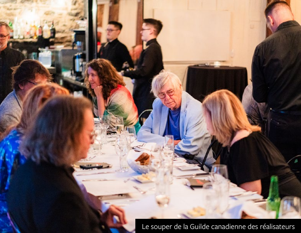
Le souper de la Guilde canadienne des réalisateurs