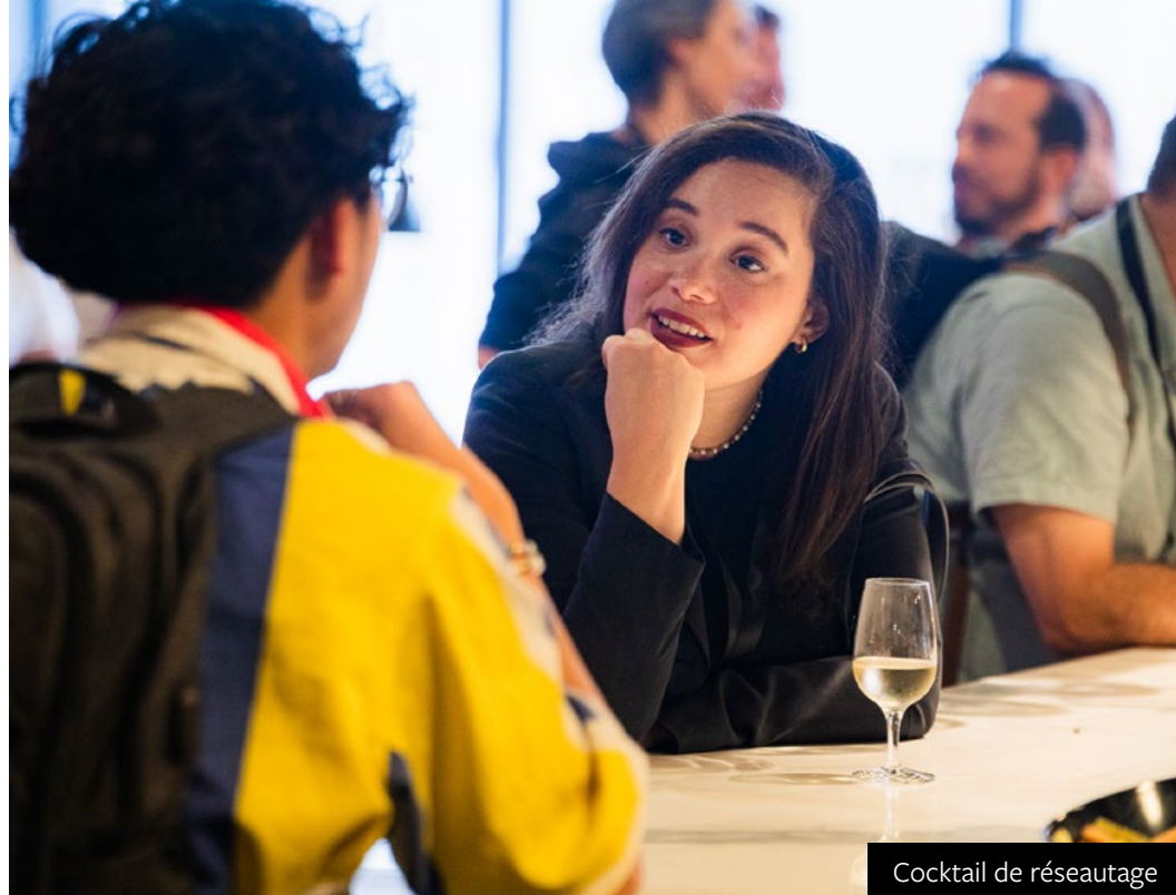
Cocktail de réseautage