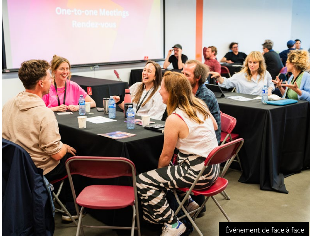
Événement de face à face