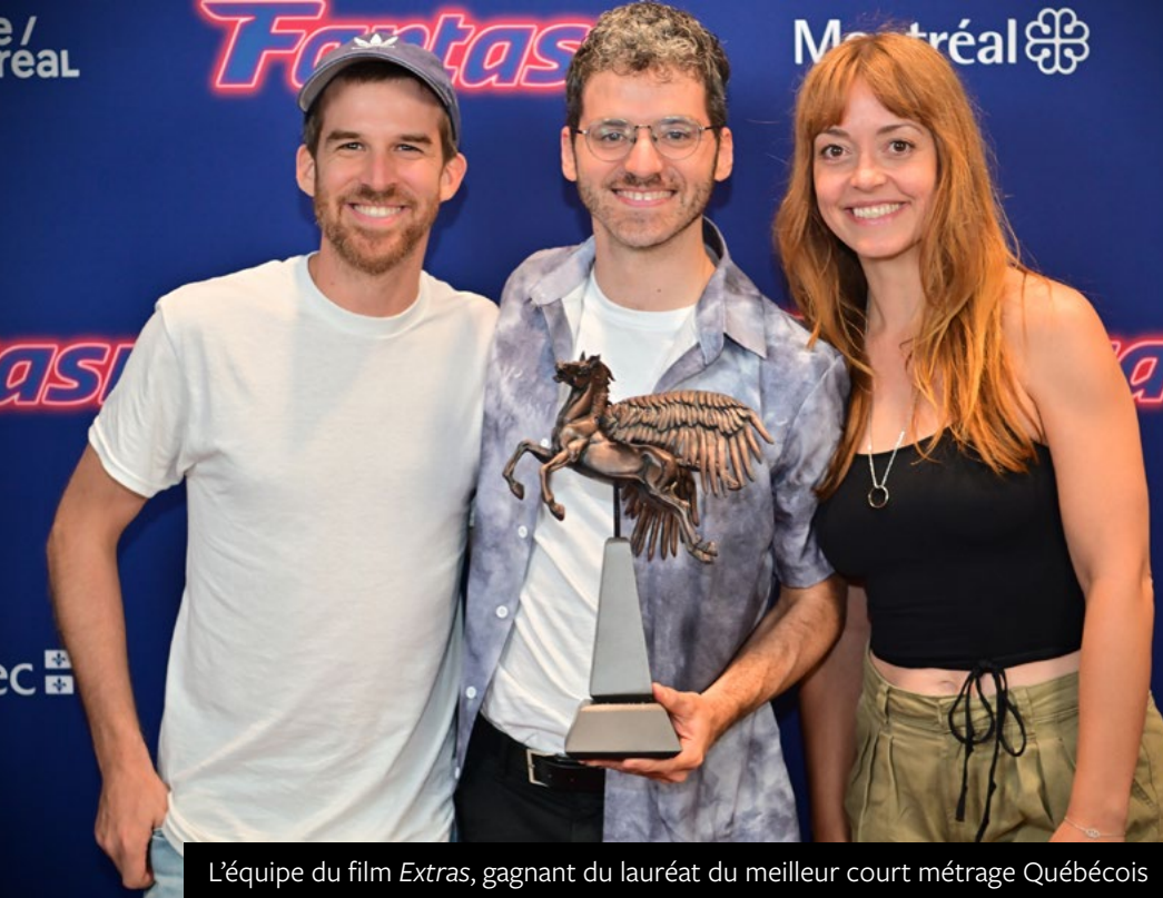
L'équipe du film Extras , gagnant du lauréat du meilleur court métrage Québécois