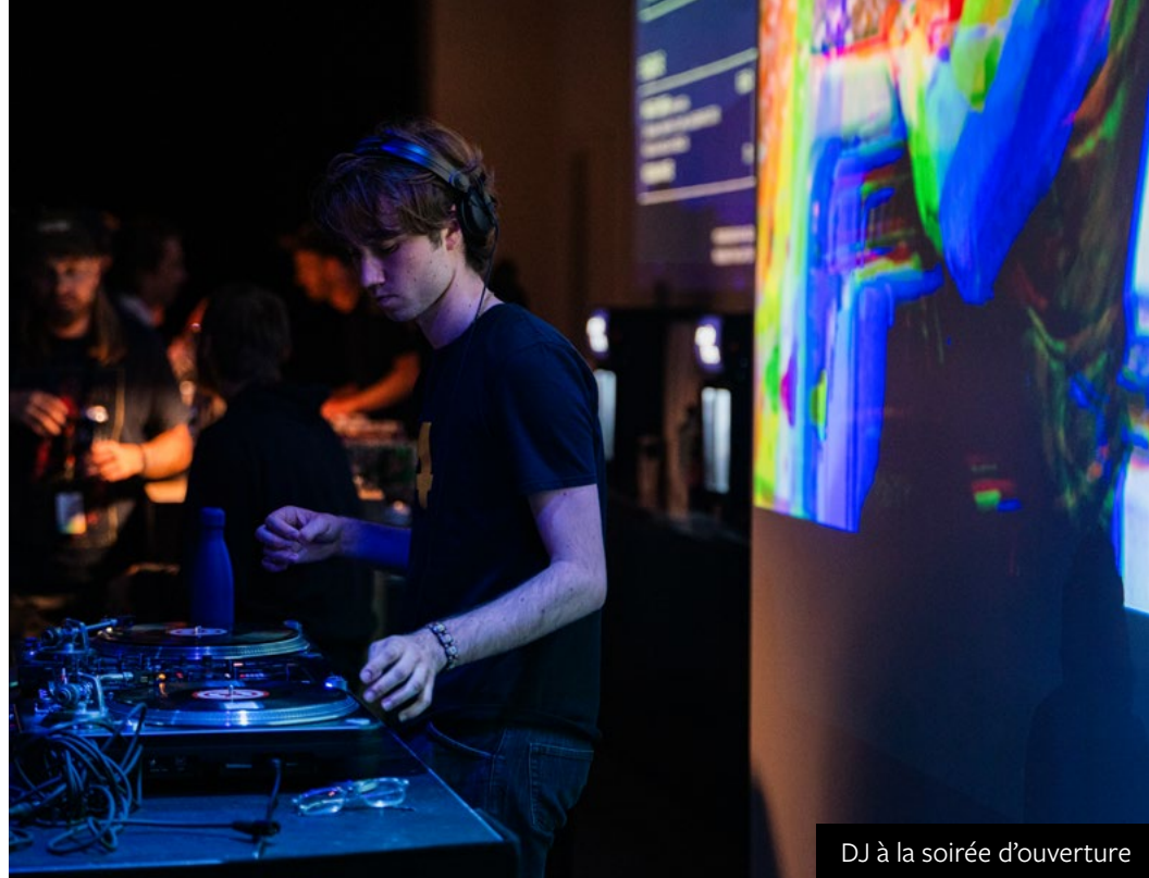
DJ à la soirée d'ouverture