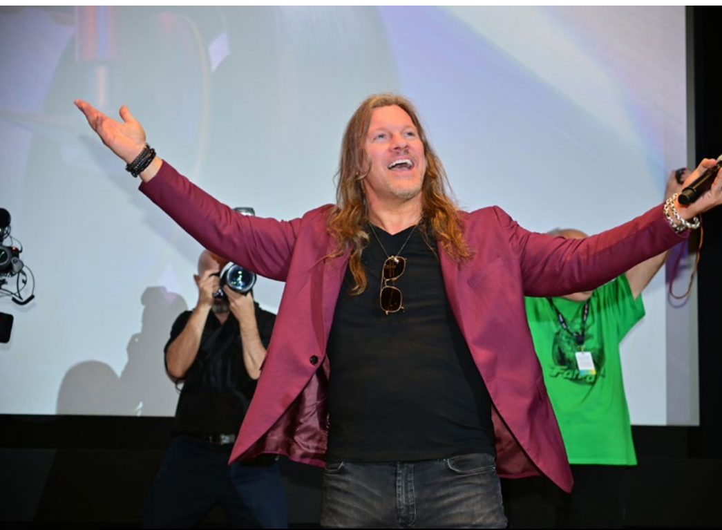
Lutteur de renommée internationale, Chris Jericho, à la première de Dark Match