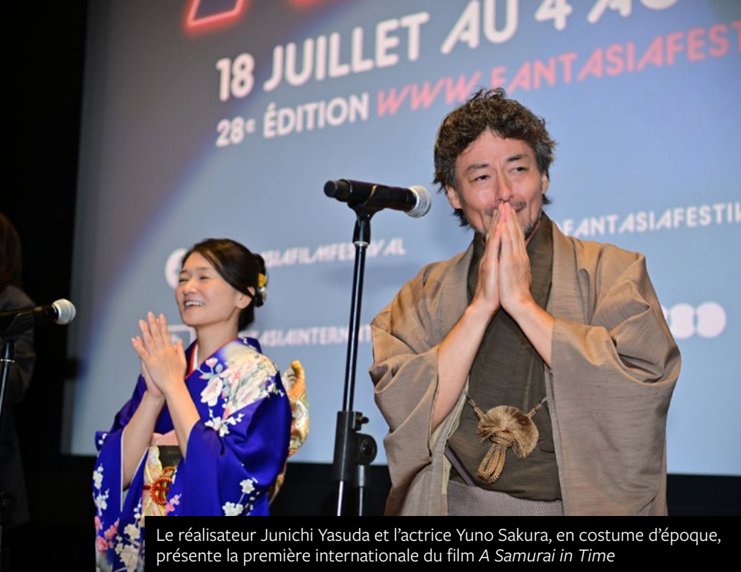
Le réalisateur Junichi Yasuda et l'actrice Yuno Sakura, en costume d'époque, présente la première internationale du film A Samurai in Time