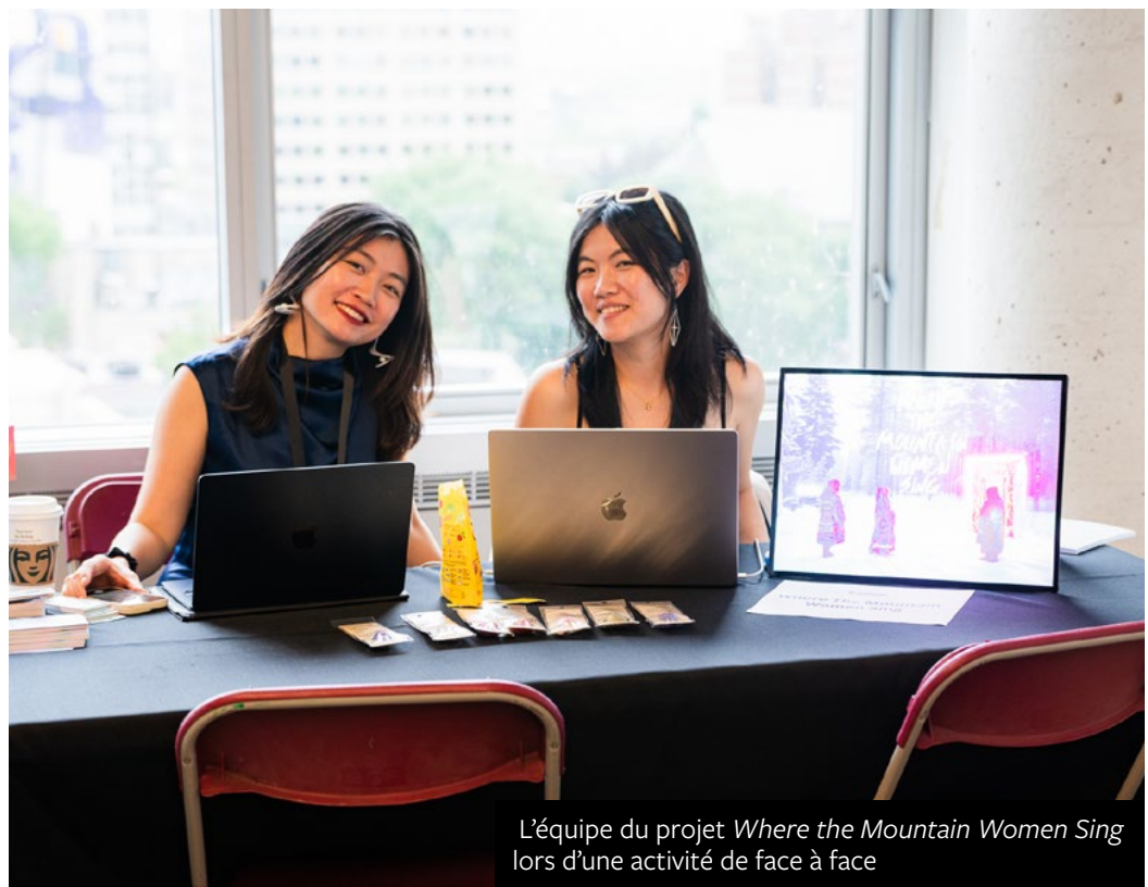
L'équipe du projet Where the Mountain Women Sing lors d'une activité de face à face