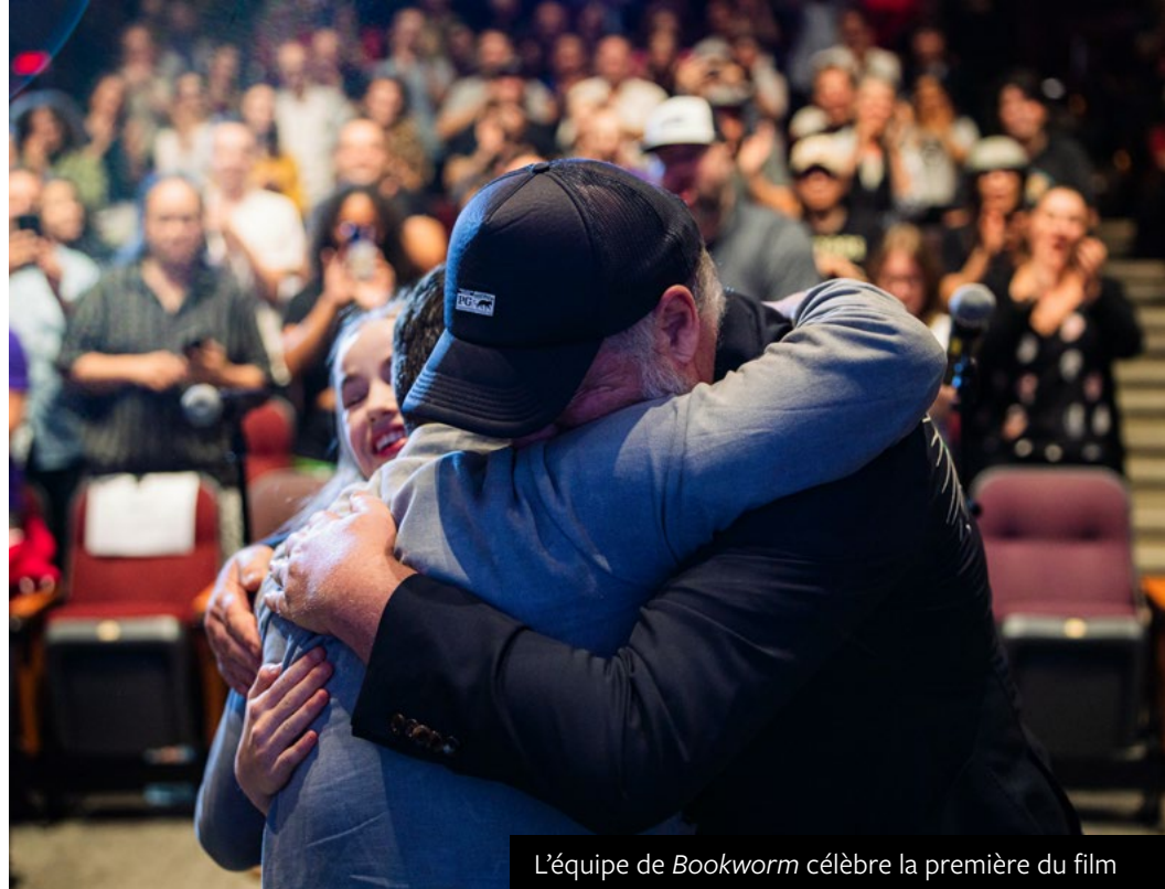
L'équipe de Bookworm célèbre la première du film