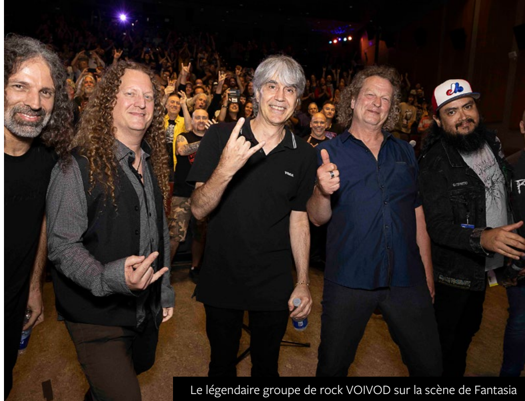
Le légendaire groupe de rock VOIVOD sur la scène de Fantasia