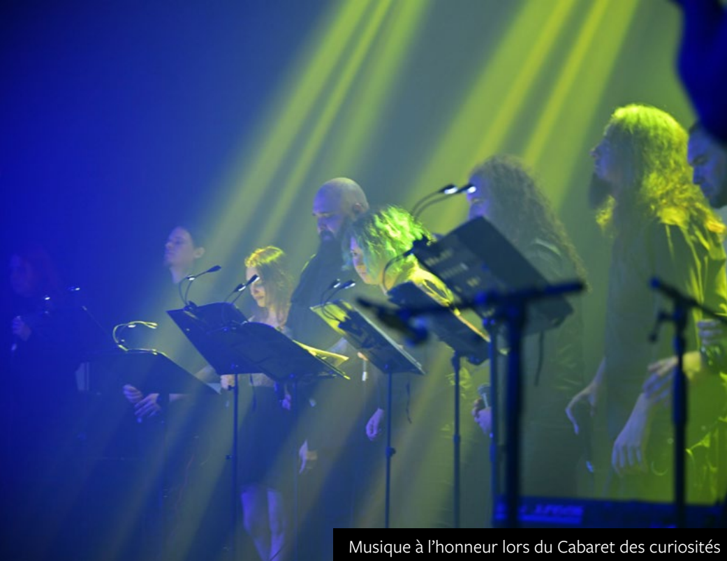
Musique à l'honneur lors du Cabaret des curiosités