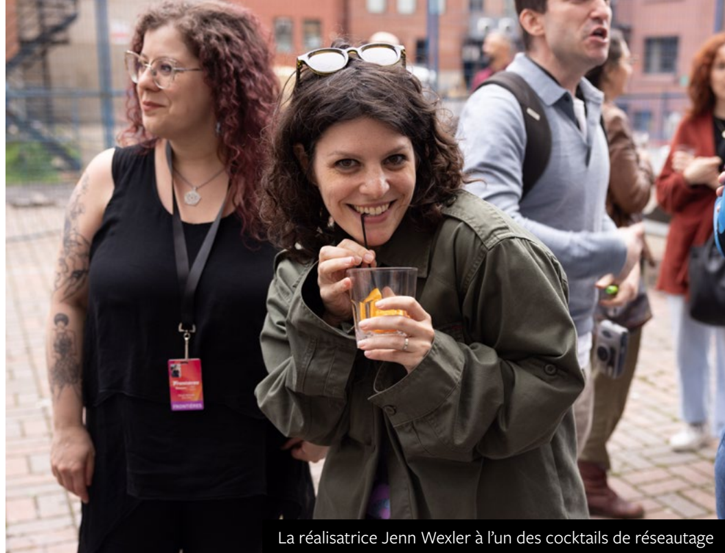
La réalisatrice Jenn Wexler à l'un des cocktails de réseautage