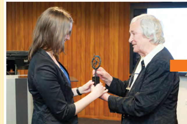
De Marina van Damme Beurs, een particulier fonds op naam

Tenslotte kunt u ook een eigen "fonds op naam" krijgen, met een eigen, nader te bepalen doel. Dit kan door schenking van een éénmalig bedrag, of door jaarlijkse storting in het eigen fonds. Dit kan uiteraard ook via een testamentaire begunstiging.