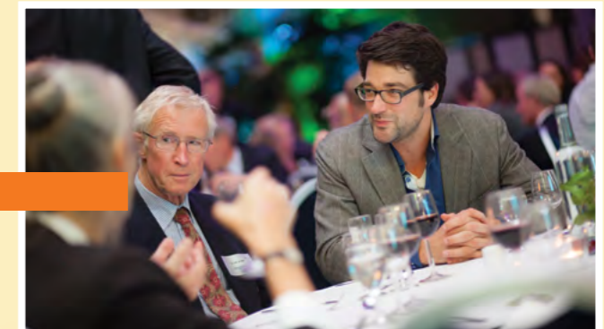
Goede Vrienden Diner 2013