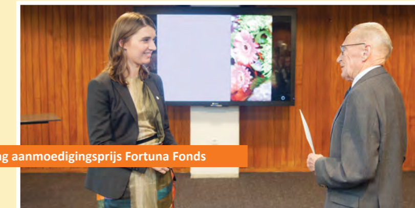
Uitreiking aanmoedigingsprijs Fortuna Fonds