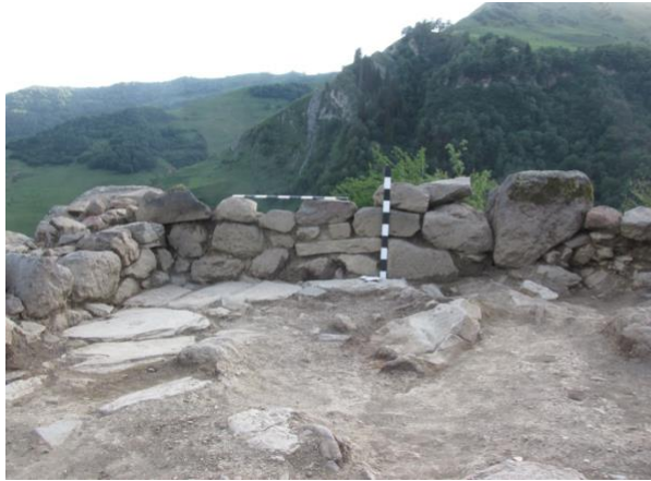
სურათი 10. ნაგებობა, სამხრეთ-დასავლეთ კედელი