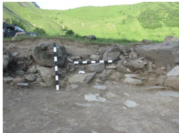
სურათი 13. ნაგებობა, აღმოსავლეთი კედელი