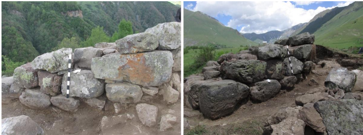
სურათი 1, 2. კომპი, სამხრეთ-დასავლეთ კედელი

კომპი მიეკუთვნება ე.წ. “ზურგიან” კომპოტა ტიპს (სურათი 17). ამ ტიპის კომპები მხოლოდ აღმოსავლეთ საქართველოშია გავრცელებული, განსაკუთრებით კი არაგვის ხეობაში. ხადა ამ მხრივაც განსაკუთრებით გამოირჩევა და ტყუილად როდი უწოდებენ “სამოცი კომპის ხეობას.” ზურგიანი კომპები ძირითადად X საუკუნემდეა აგებული, მომდევნო ხანაში ამ ტიპის კომპებს იშვიათად აშენებდნენ და ისინი სწორკუთხა კომპებმა ჩაანაცვლეს (გვასალია, და სხვ. 1983:13). ზურგიანი კომპები სიმაღლეში თანდათან ვიწროვდება. ქვედა სართული ჩვეულებრივ ყრუ სართულია და მიწით ან ქვებითაა ამოვსებული. შესასვლელი, როგორც წესი, რამდენიმე მეტრის სიმაღლეზეა დატანებული და იქამდე ასვლა მხოლოდ მისადგმელი კიბით თუ იქნებოდა შესაძლებელი. სქელი კედლების გამო კომპის შიდა სივრცე ძალზე ვიწრო და საცხოვრებლად გამოუსადეგარია. ამიტომ ისინი ძირითადად საგუმბაგო კომპების ფუნქციას ასრულებდნენ, რაზეც მათი განლაგებაც მეტყველებს: ისე არიან განლაგებულნი, რომ მთელს ხეობას სრულად აკონტროლებდნენ. კარი და სარკმლები ყოველთვის კომპების ბრტყელ მხარესაა დატანებული. ზურგი უმეტესად მთისკენაა მიქცეული, რაც კომპს ზვავებისა და ქვების ცვენისაგან იცავდა (თუმცა ჩვენს მიერ გათხრილი კომპისგან მთა საკმაოდ შორსაა და ეს საშიშროება ნაკლებად ემუქრებოდა), ხოლო “ბრტყელი” მხარე ყოველთვის ხეობას გაჰყურებს.