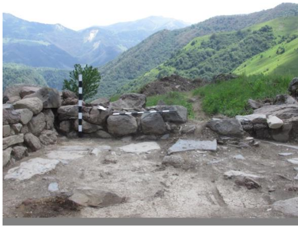
სურათი 12. ნაგებობა, სამხრეთი კედელი