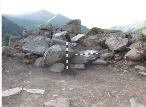
სურათი 11. ნაგებობა, ჩრდილოეთი კედელი