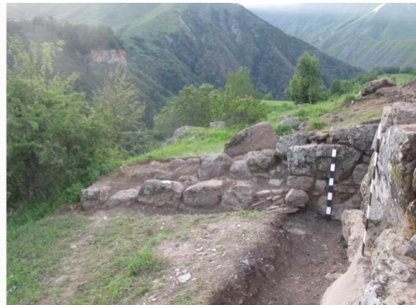
სურათი 15. ნაგებობის უკანა კედელზე მიშენებული კედელი