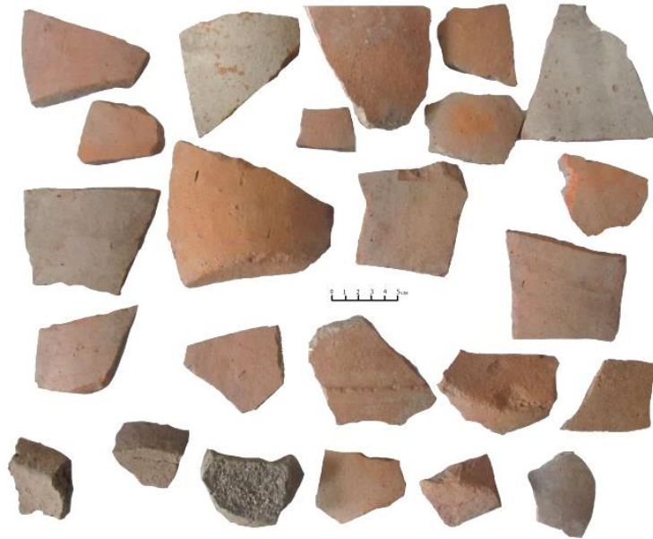
სურათი 16. ნაგებობაში და მის გარე პერიმეტრზე აღმოჩენილი კერამიკა