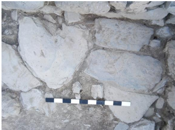
სურათი 14. ნაგებობა, მოკირწყლული იატაკი