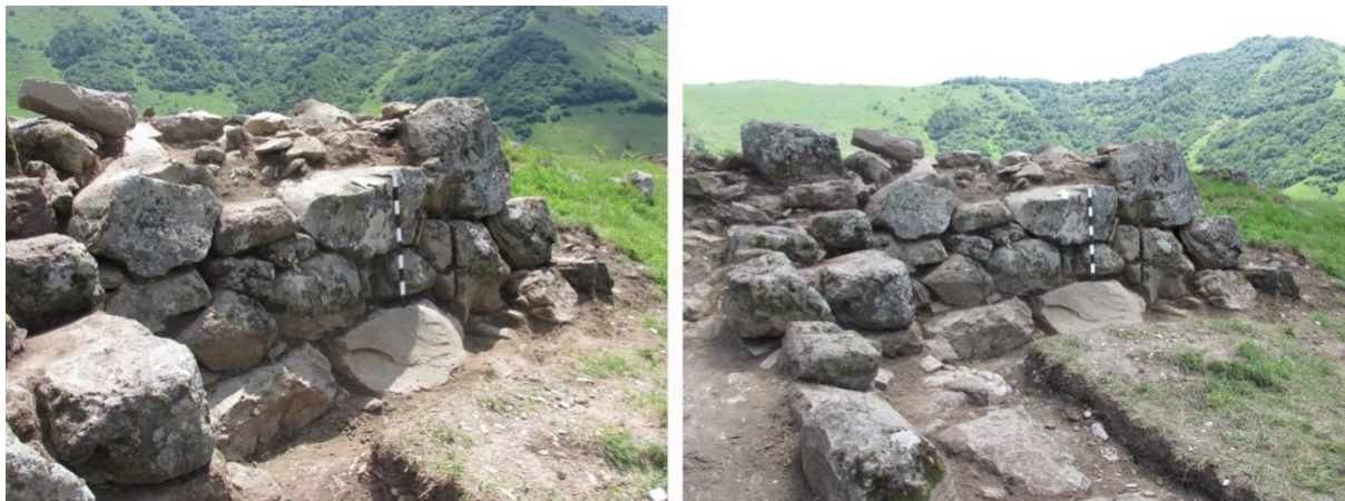
სურათი 8, 9. ნაგებობა, დასავლეთი კედელი

ხადის არქიტექტურულ ძეგლებს შორის საკულტო ნაგებობებს მნიშვნელოვანი ადგილი უკავიათ. მათ შორის არის ეკლესიები, რომლებიც საფორტიფიკაციო ნაგებობებთან ერთად ერთიან არქიტექტურულ კომპლექსს ქმნიან, მაგ. ცეცხლიჯვრის ეკლესია, ქოროლოს ღვთისმშობელი, წკერეს კვირაცხოველი და სხვა. ამ ეკლესიებისათვის დამახასიათებელია უაფსიდო, სწორკუთხა საკურთხეველი (გვასალია და სხვ. 1983:17). ამ ნიშნებით ჩვენს მიერ გათხრილი ნაგებობა ამ ტიპის ეკლესიებს წააგავს. დამხრობაც თითქმის აღმოსავლეთ-დასავლეთზეა ოდნავი გადახრით. საქონლის სადგომისთვის კი არა გვგონია ასეთი მყარი მეგალითური ნაგებობა აეგოთ. გარდა ამისა, სამხრეთის კედლის ის ღიობი, რომელიც ჩვენ კარი გვგონია (სურათი 18), საქონლის ბაგისთვის ძალზე ვიწროა და თუ ის მაინც იყო საქონლის სადგომი, შედარებით მოგვიანოდ უნდა იყოს აშენებული, იმ დროს, როცა კომპი უკვე აღარ ფუნქციონირებდა. სხვაგვარად მათი ასე ახლოს ყოფნა ძნელი ასახსნელია.