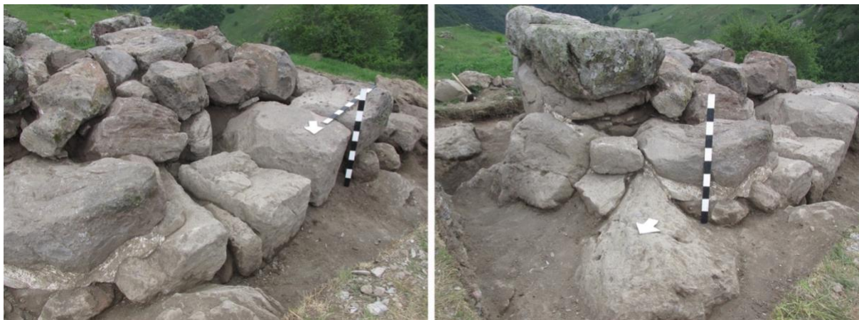
სურათი 3, 4. კომპი, ჩრდილო-დასავლეთი კედელი.კედელი