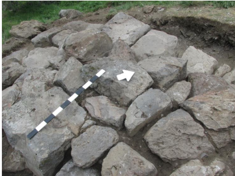
სურათი 5. კომკი, ქვებით ამოვსებული „ყრუ“ სართული