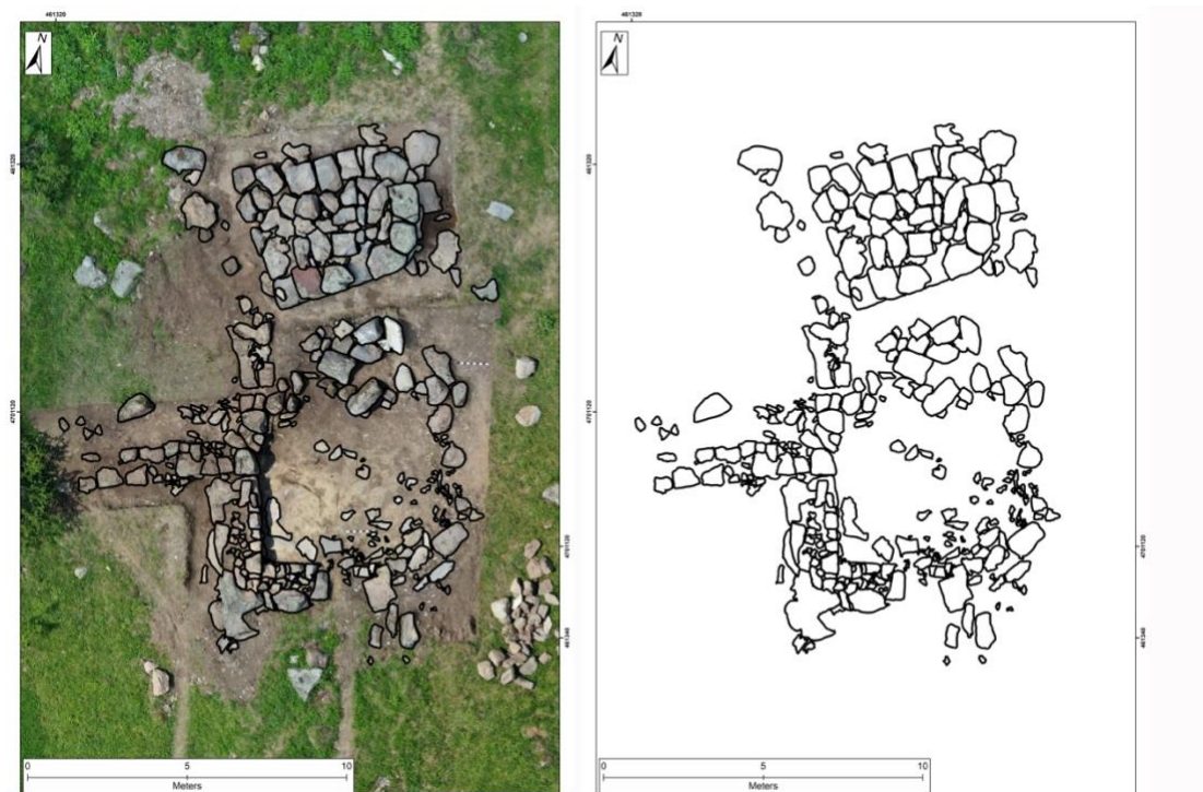
სურათი 18. ნაგებობა (გრაფიკა)