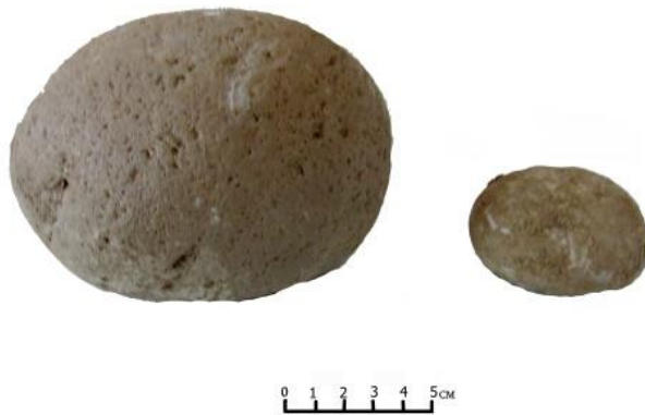
სურათი 7. კოშკთან აღმოჩენილი ქვის საბრძოლო ბირთვები