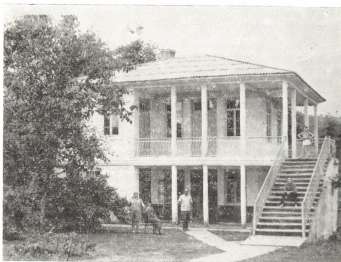
Рис. 2. Жилой дом жителя села Джьгарда Н. Ф. Ашуба.

Первый этаж состоит из зала и столовой с кухней, в середине которых имеется камин так, чтобы он мог одновременно отапливать все помещение. В центре зала стоит круглый стол со стульями, у правой стены — диван, у задней — сервант, на котором стоят свежие цветы, а в углу — телевизор. На левой стене рядом с камином висит репродуктор и стенные часы. Свое свободное время семья проводит здесь, здесь принимают гостей. Во вторую часть данного этажа можно войти через двустворчатые двери. Она имеет продолговатую форму (9 × 4 м). В ней располагается печь для приготовления пищи, примыкающая к задней стенке камин, но чаще ее заменяет