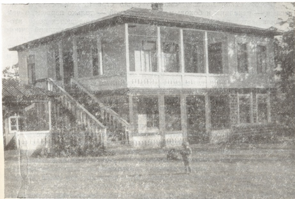
Рис. 1. Жилый дом колхозника колхоза имени В. И. Ленина села Тхиня Я. К. Бигвава.

Основным строительным материалом крестьянин считал лес, которым так богата и сама Абхазия. Но рост семейных доходов обусловленных усилением экономической мощи общественных производств изменил мнение сельских жителей. Теперь деревянные дома, построенные до советизации края, сохранились лишь в труднодоступных местностях предгорных сел и составляют единицы. Современный жилой дом сельской семьи в Абхазии представляет собой двухэтажное кирпичное здание, покрытое шифером, оцинкованным железным листом и реже — черепицей. Вместе с тем, нетрудно заметить то, что развитие новых форм домов среди абхазов происходит в одном направлении — по линии преобразования национального типа жилища, характерного как для Абхазии, так и для всей Западной Грузии, применительно к требованиям современной сельской жизни со все более широким применением национальных элементов строительного искусства. Что касается архитектурного сходства национальных жилищ абхазов и мегрелов, то оно порождено главным образом многовековым