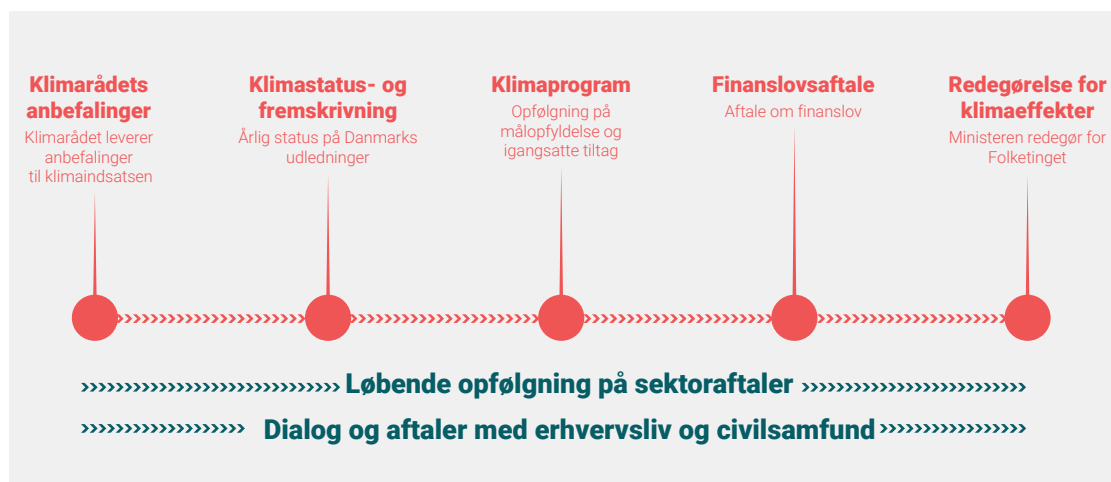
Figur 1 Årets gang på klimaområdet

Klimahandlingsplanen leverer et solidt fundament af konkrete reduktionstiltag i Danmarks klimaindsats kombineret med målrettede udviklingstiltag. Klimaloven sikrer en fast modus for opfølgning frem mod 2030. Det skal sikre, at Danmark kommer i mål med 70 pct. målet. Modus for opfølgning vil bestå af Klimarådets anbefalinger til regeringen, den årlige status på udledningerne i klimastatus- og fremskrivningen, konkret opfølgning på målopfyldelse og tiltag i klimaprogrammet forud for den årlige finanslovsproces. Dertil vil der løbende være opfølgning på sektoraftaler samt aftaler med erhvervsliv og civilsamfund, jf. figur 1.