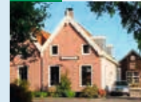
BONTE HUIS ANNO 2013.