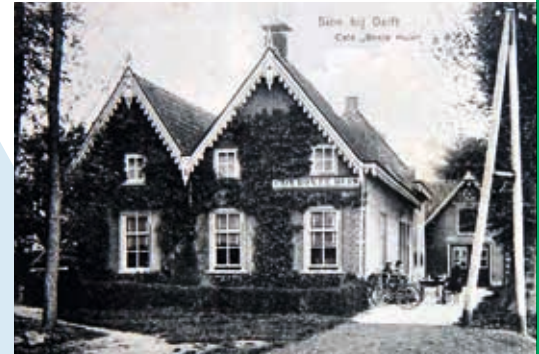
HET BONTE HUYS.

Aan het begin van de 80-jarige oorlog was er flink wat ellende in de regio. 1566 was het pestjaar. In 1570 was er de Allerheiligenvloed met grote overstromingen. Eind 1573, toen de Spanjaarden onder aanvoering van veldheer Valdez ons gebied bezette, vluchtten de plattelandsbevolking naar de stad Delft. Later, in 1574, waren de polders rondom Delft onder water gezet om de Spanjaarden tegen te houden. Na Leiden's ontzet, 3 oktober 1574, begon heel langzaam de opbouw.