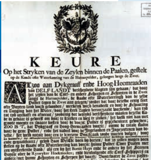
KEUR OP HET STRIJKEN VAN DE ZEILEN OAD INV.

In de tweede helft van de negentiende eeuw werd de Zweth een belangrijke vaarroute voor de Westlanders die met hun schuiten vol groente en fruit op weg waren naar de markten in Amsterdam en Rotterdam. Een ooggetuigenverslag uit die periode meldt dat de Zweth 'bruin van de zeilen' zag. Gewoonlijk voeren de schuiten in konvooi. De komst van veilingen en het railvervoer maakte een einde aan deze Westlandse scheepvaart.