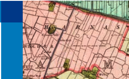
UITSNEDE UIT DE KAART VAN 't HOOGHE HEEMRAEDSCHAP VAN DELFLANT, NICOLAES EN JACOB KRUIKIUS (1712). VINDPLAATS HOOGHEEMRAEDSCHAP VAN DELFLAND TE DELFT INV.NR. OAD 726.

De bewoning in de Harnaspolder, de Woudse Polder en de Groeneveldse Polder was na 1135 georiënteerd op de Zweth en de weg erlangs. Aanvankelijk werd op het hoog gelegen veenkussen ten zuiden van de Zweth volop gewoond, eerst op het maaiveld en vanaf de tweede helft van de twaalfde tot in de veertiende eeuw op terpen. In de Woudse Polder zijn nog enkele van deze verlaten verhoogde woonplaatsen waarneembaar. Op een dergelijke locatie in de Groeneveldse Polder stond in de dertiende en veertiende eeuw het adellijke huis van de heren van Groeneveld. Het gelijknamige kasteel werd in 1420 definitief verwoest.