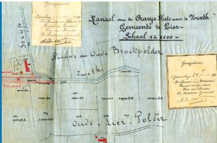
ONTWERP ZWETHKANAAL INV. NR. OAD 8797.

Door alle vaarsloten en kanalen die in het gehele traject op de Zweth uitkwamen, groeide de betekenis van dit boezemwater, dat ook wel wordt aangeduid als 'de spons van Delflands boezem'. De recente herinrichting van de zone rond de Zweth versterkt de natuur- en recreatieve waarde van deze belangrijke oude waterloop.