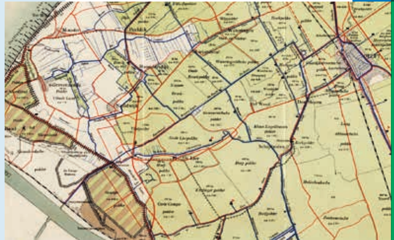
OVERZICHTSKAART VAN DELFLAND 1939 INV. NR. KVD 79.

Kort na 1135 startte de aanleg van dijken om de Lee te beteugelen. Aanvankelijk betrof het zogenoemde lengtedijken ten noorden en zuiden van de hoofdtak en zijarmen van de Lee, onder andere de huidige Noordlierweg en de Oostbuurtseweg. Later zorgde de Maasdijk (ca. 1250) voor de definitieve afsluiting van de Lee, waarna het zeewater geen kans meer had om het achterland te bedreigen. Het gevolg hiervan was dat de Zweth niet meer op de Maas kon lozen. Nieuw gegraven vaarten, namelijk de Monsterwatering, de Harnaschwatering, de Noordhoornsewatering en de Kastanjewatering, zorgden ervoor dat het Zwethwater via de Vlaardingervaart en de Schie afgevoerd kon worden naar de Maas. In 1896 kwam het Zwethkanaal gereed, van de 'Kromme Zweth' bij de Strijp naar de Oranjesluis in de Maasdijk. Dit was een grote verbetering in de afwatering van Delfland.