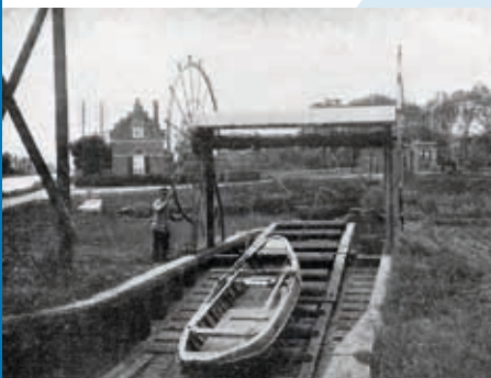
EEN VOORBEELD VAN EEN WINDAS, DEZE UIT NIEUWERSLUIJ, GEÏLLUSTREERDE ATLAS, R. BOS. UITGEVERIJ P. NOORDHOFF, GRONINGEN, 1923.