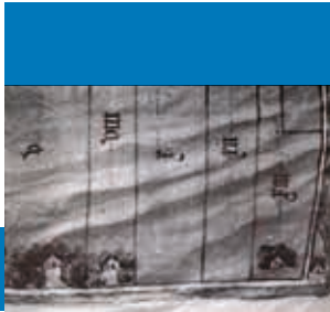
PERKAMENTEN KAART CA. 1530, RECHTSONDER HET BONTE HUYS; NAAR LINKS DE NOORD-HOORNSEWEG.

De gelagkamer was in het voorhuis. Omstreeks 1847 kwam er in een deel van de achterkamer ook nog een winkeltje, waar levensmiddelen, olie en petroleum aan passanten en omwonenden werden verkocht. Vanaf 1893-1903 deed het Bonte Huis voor de omringende tuinders dienst als veiling van groente en fruit. In het begin van de twintigste eeuw kwam er naast de herberg een kinderspeeltuin. Delftenaren bezochten voor de Tweede Wereldoorlog graag deze locatie. Kinderen leerden in het aangrenzende water zwemmen. In 1976 werd de gelagkamer van het Bonte Huis opgeheven.