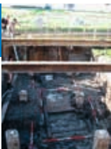
RENTANTEN VAN DE WINDAS GEVONDEN BIJ DE BOUW VAN GEMAAL HOEKPOLDER IN 2010.