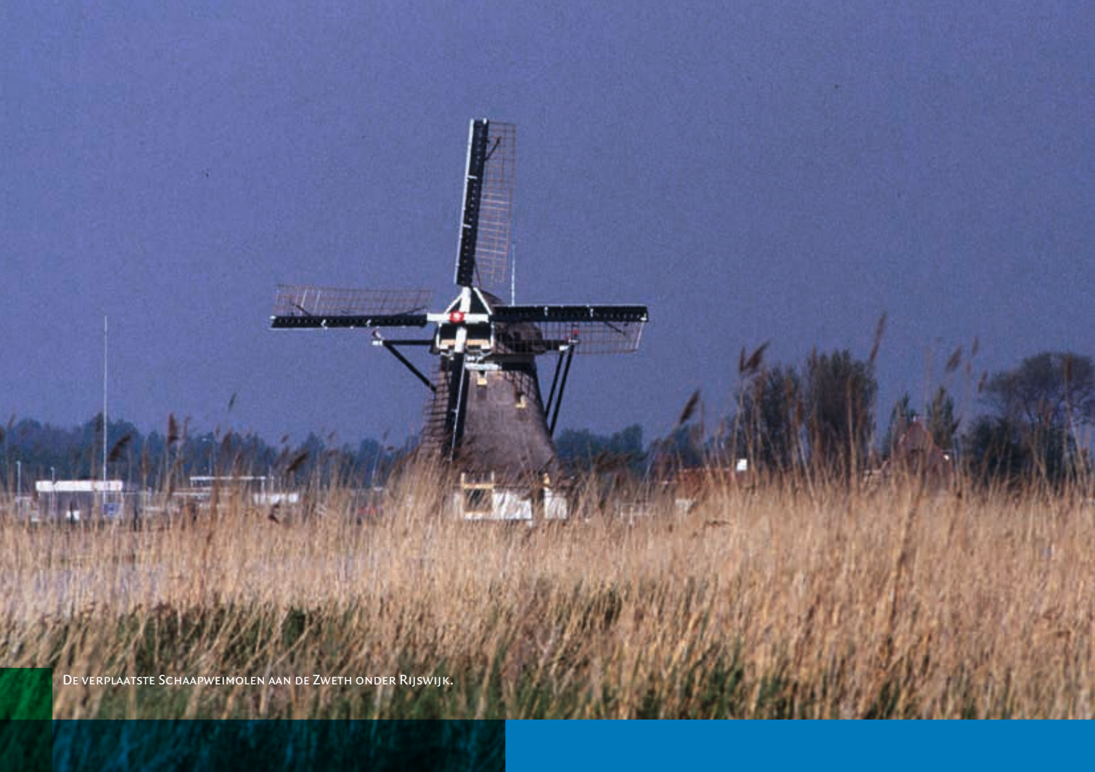
DE VERPLAATSTE SCHAAPWEIMOLEN AAN DE ZWETH ONDER RIJSWIJK.