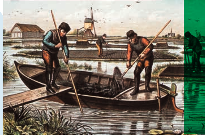
DE VEENDERIJ, SCHOOLPLAAT VAN H. SCHEPERS EN W. WALSTRA, J.B. WOLTERS 1895.

In de tweede helft van de achttiende en eerste helft van de negentiende eeuw zijn de Wateringveldsche Polders verveend en drooggemaakt, waardoor het niveau van deze polders sterk is gedaald (nu 3,80 m tot 4,14 m beneden NAP). Ten behoeve van de drooglegging van de veenplas werden in 1847/1848 in de polder (halverwege de Dorpskade tussen de Middenweg en de Zweth) twee extra molens met scheprad gebouwd, zodat er met de Bovenmolen een Molendriegang ontstond. De fundering van één van deze molens (de Middenmolen) werd in 1999 bij de aanleg van de rotonde halverwege de Dorpskade teruggevonden. Een muurfragment met cirkelvormige krassen van het scheprad herinnert hier aan de Middenmolen. In 1887 brandde door blikseminslag de Bovenmolen aan de Zweth af, waarna het werk van de drie molens in de Nieuw Wateringveldsche Polder werd overgenomen door een stoomgemaal en later elektrisch gemaal. Dit gemaal zorgt momenteel voor de afwatering van beide Wateringveldsche Polders. In Oud Wateringseveld herinnert de veldnaam 'Kooiland' aan een voormalige eendenkooi; de naam 'Zwarte Plas' verwijst in het gebied naar de periode van de vervening.