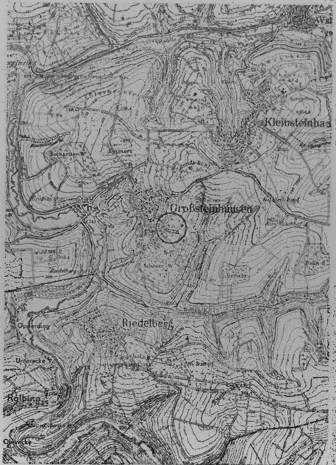
Ausschnitt aus der Topographischen Karte 1:25000. Herstellung der Druckunterlagen: Landesvermessungsamt Rheinland-Pfalz.