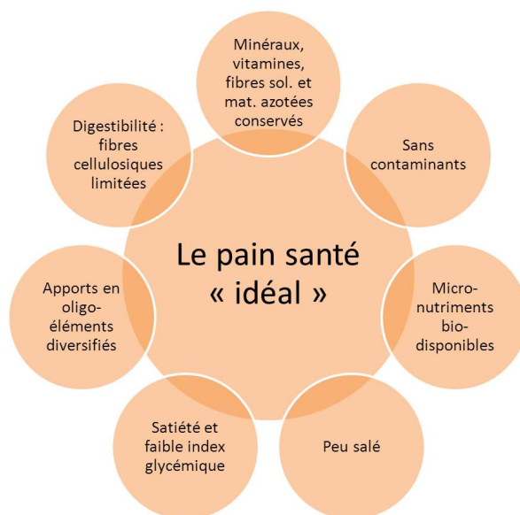
Figure 1. Buts nutritionnels