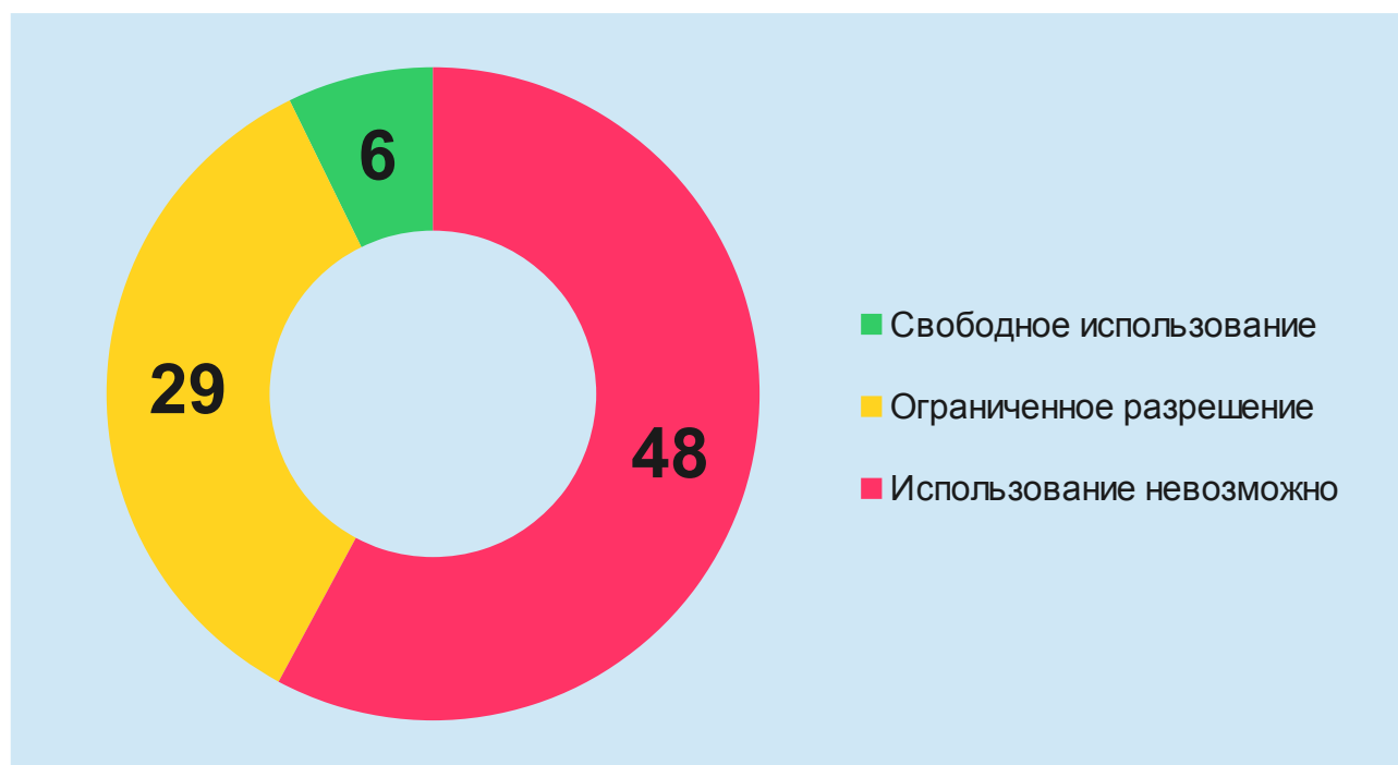
Иллюстрация 1: Распределение типов условий использования сайтов ФОИВ

Из 6 сайтов, позволяющих свободное использование, однозначно корректное разрешение на свободное использование материалов указано на четырёх сайтах — Президента РФ, Председателя правительства РФ, Правительства РФ и Минкомсвязи РФ.