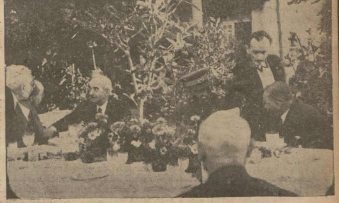
Aziz Misafirimiz ve Gazi Hazretleri Yatklüpte