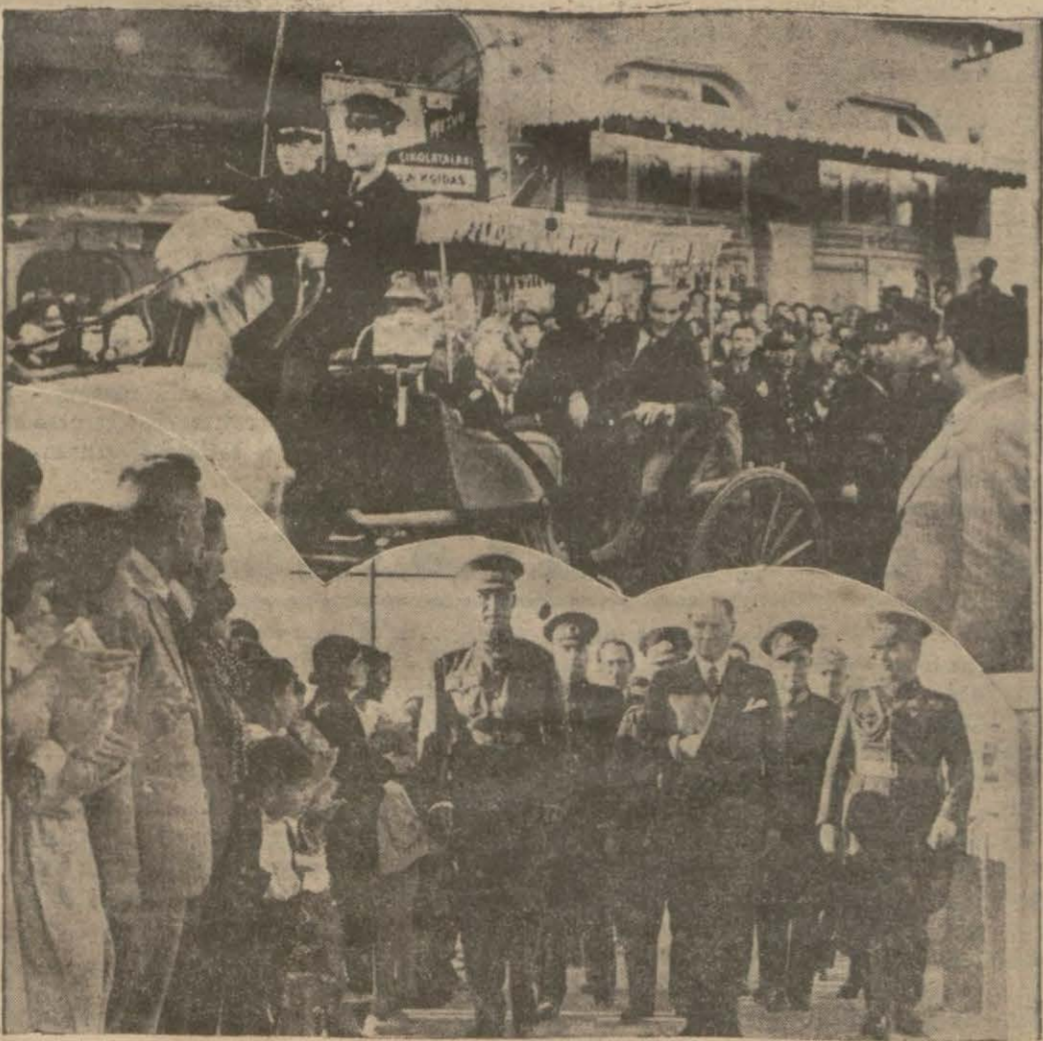
Şehinşah Hazretleri ile Gazi Hazretlerinin Büyükkadayı teşriflerinden iki intiba

mişti. Avusturya Sırbistana taarruz ederse, Rusya yardım edecek. Rusya Sırbistana yardım ederse, Almanya, Avusturya ile imzaladığı ittifak muahedesi iktizası, Rusyaya harp ilan edecek. Almanyanın muahedesi üzerine Fransa gene bir ittifak muahedesi iktizası, Rusyanın yardımına koşacak v.s. v.s. Devlet adamları iradelerini, otomatik surette harekete geçen bu sisteme kaptrmışlardı. Sanki düğmesine basınca harekete gelen bir makine gibi, Saray Bosna suikastı üzerine hâdiseler yürümeğe başladıkimse de 1914 faciasının önüne geçemedi.