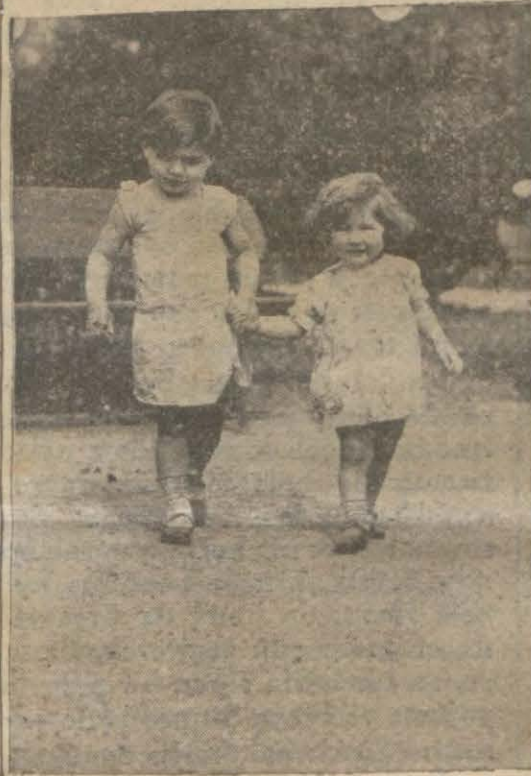
Güzel havada gezinti

Anlaşılan nebatın ayakları ile dilleri eksik. Acaba eksik mi? Onu da henüz bilmiyoruz ya!..