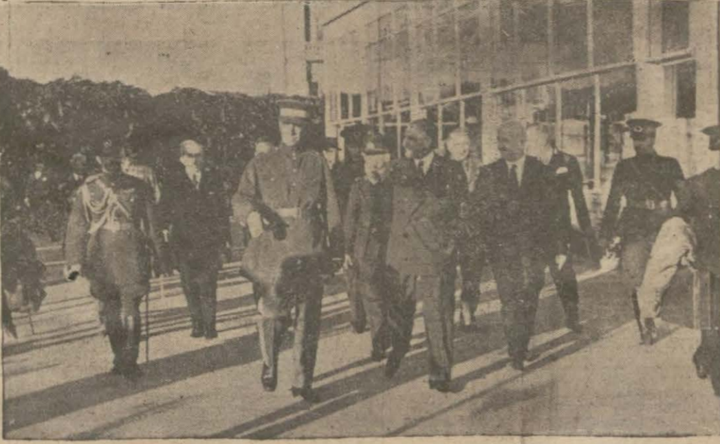
Şehinşah Hz. Gazi Hazretleri Yatklüpten çıkarılarken