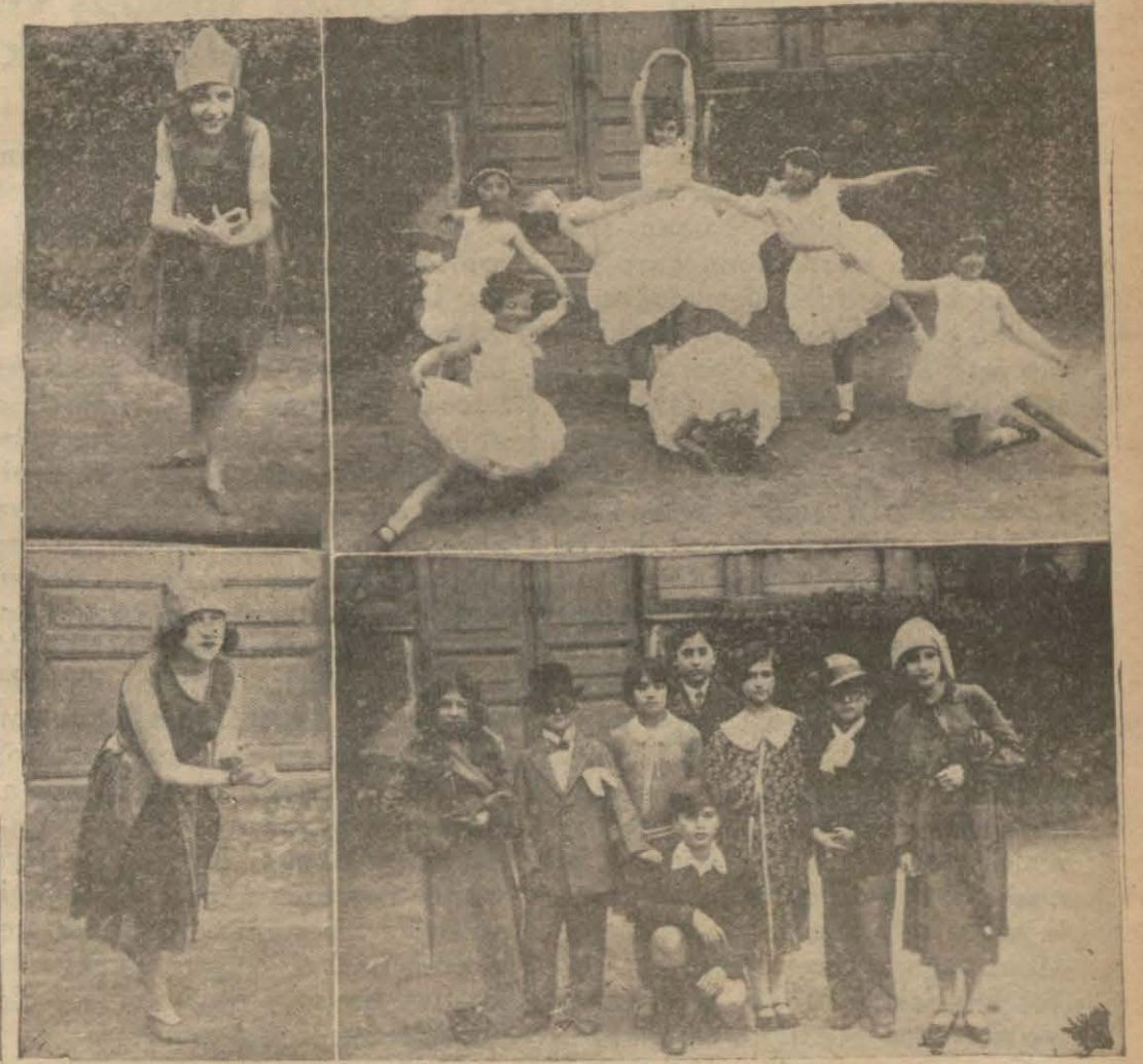
İlk mekteplerde temsiller

Yıldızların hararetlerine gelince: "Mutavassıt bir hararet neşreden," güneşimizde hararet derecesi 5320 dir. Kutup yıldızımızın harareti 8000 dir. Hiç te ismile münasip değil değil mi? Gökyüzünün en parlak yıldızı olan Sirius'un harareti 14.000 derecedir. Sevir bürcünün bazı yıldızlarında ise hararet derecesi 40.000 i bulmaktadır.