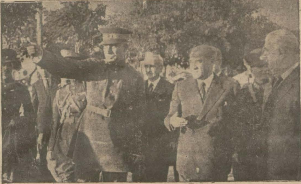
Şehinşah Hazretleri ile Gazi Hazretleri Yat klübünde

Tel: { Müdür: 24318, Yazı işleri müdürü: 24318 İdare ve Matbaa: 24310.