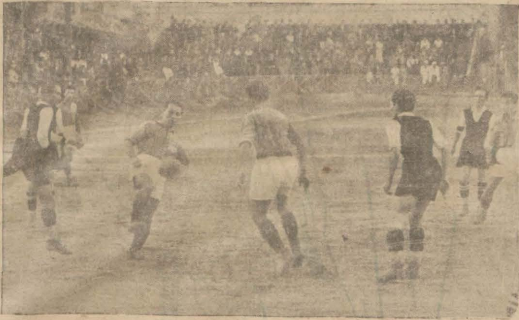
Bugünkü maçtan bir intiba

Dün Taksim stadında Beşiktaş - Galatasaray takımları İstanbul şildi için karşılaştılar. Bine yakın seyirci bu iki takımın maçını görmeğe ve finalist olan Fenerbahçenin karşısına Beşiktaş'ın mı, yoksa Galatasaray'ın mı kalacağını anlamaya gelmişlerdi.