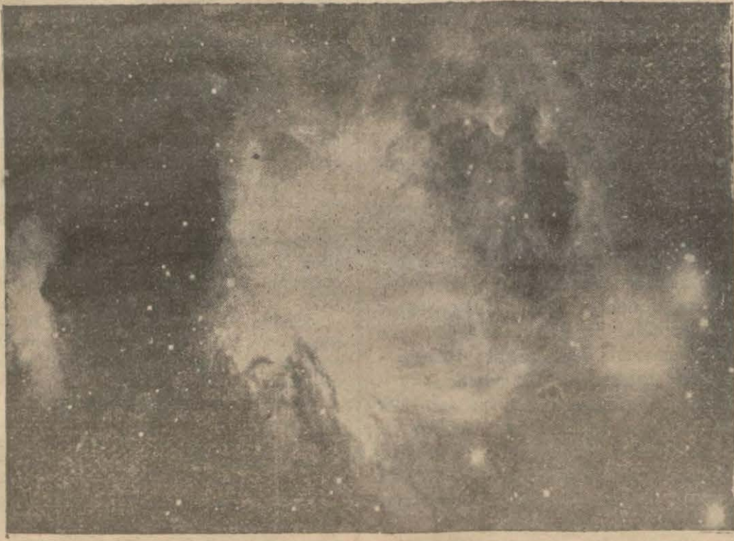
Büyük Nebülözlardan Oryon'un fotoğrafisi

Teleskopla sadece yıldızların kuturları değil, hareketleri de öl-