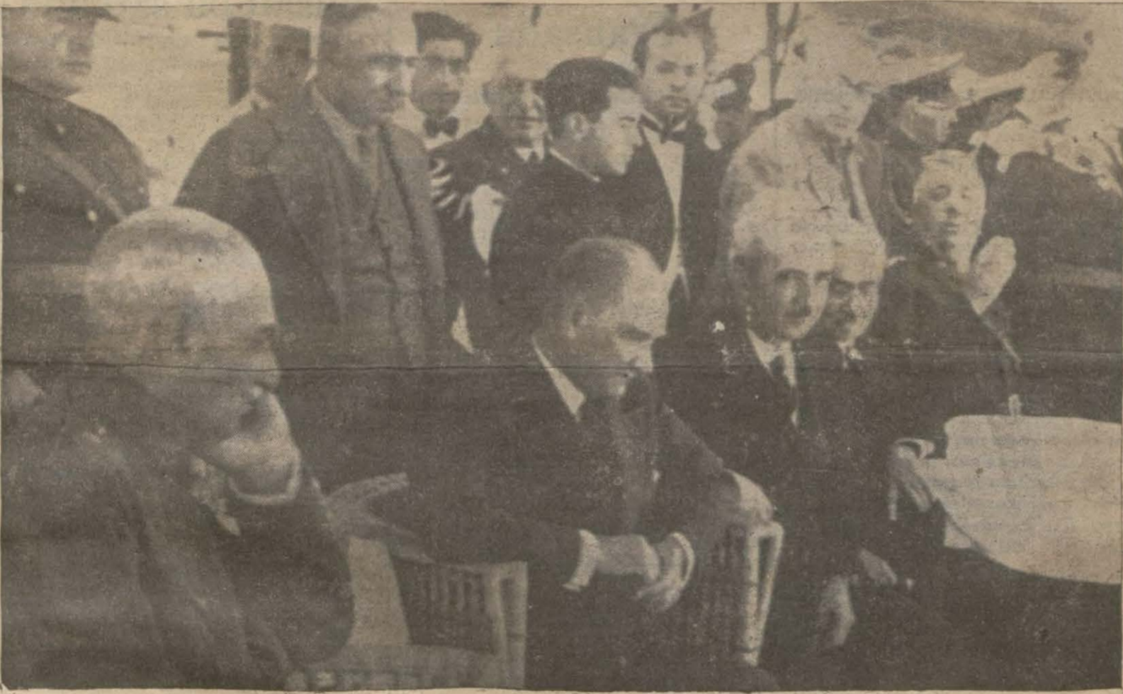
Şehinşah Hazretleri, Gazi Hazretleri ve İsmet Paşa Hazretleri Süadiyede

Şehinşah Hz. ile Gazi Hazretleri dün Suadiye ve Büyükkadayı teşrif ettiler ve halk tarafından şiddetle alkışlandılar