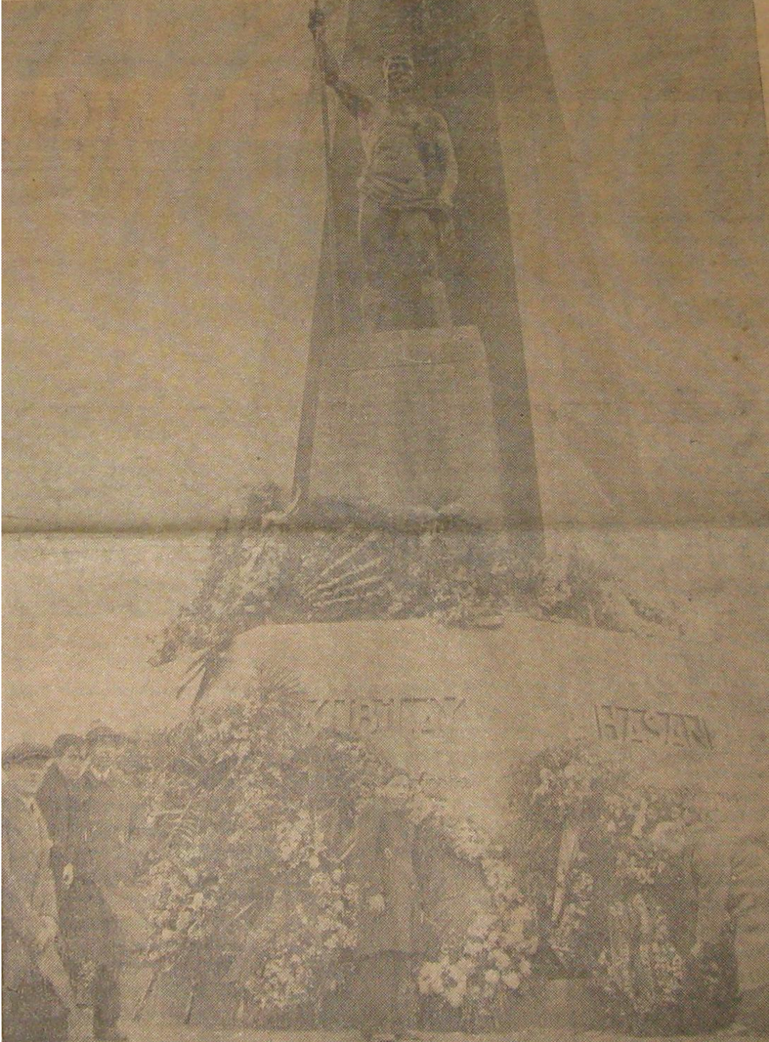
Kubilay Anıtı'nın Açılış Sırasında Çelenk Konulurken