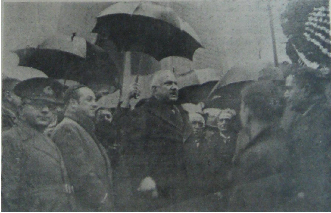
Recep Peker Konuşma Yaparken