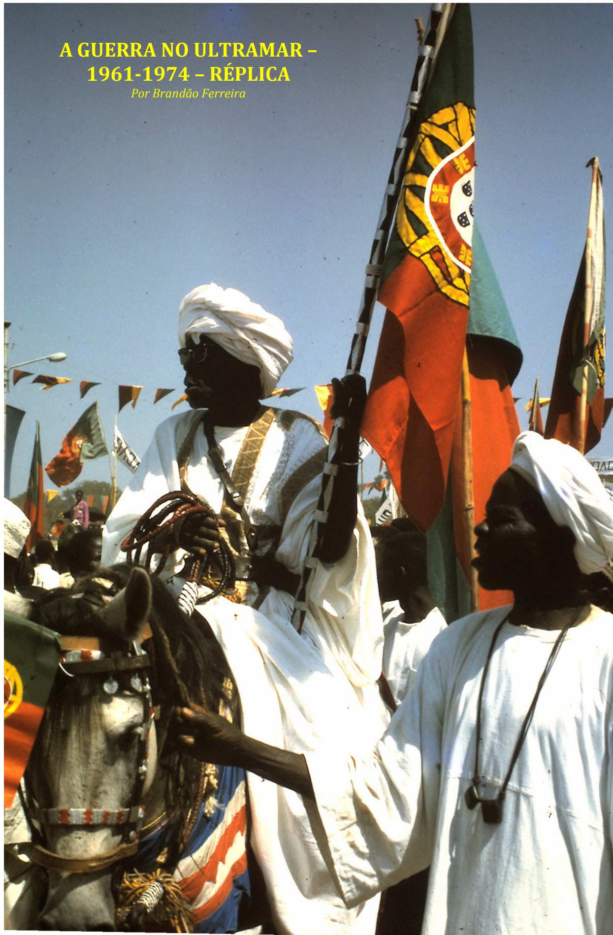
Chefe tradicional fula, empunhando a Bandeira Nacional