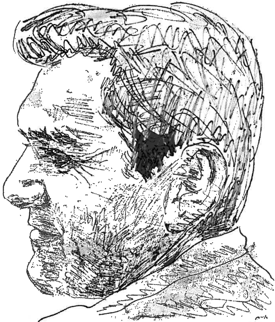
רישום מאת חיים טופול