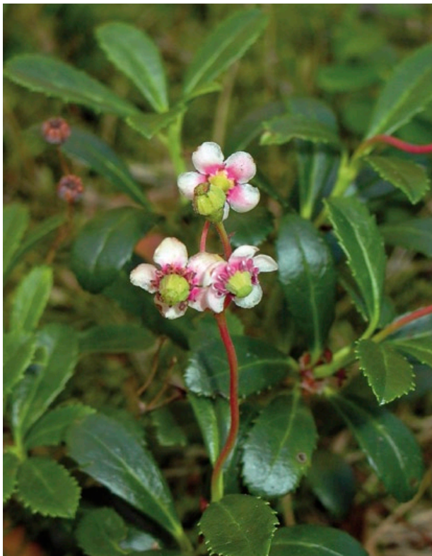
Blütenstand des Dolden-Winterliebs ( Chimaphila umbellata ) inmitten einer Gruppe von Trieben.