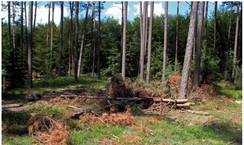
Nach Forstarbeiten zurückgelassene Äste und Baumwipfel können – ebenso wie das Befahren mit Forstmaschinen – zum Absterben von Winterlieb-Trieben führen.