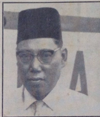
Duli Pengiran Bendahara

BANDAR BRUNEI. — Sa-lama ketiadaan Duli Yang Maha Mulia Al-Sultan dalam negeri kerana berangkat ka-London merundingkan satu perlembagaan yang bertulis bagi Negeri Brunei dua orang kerabat Diraja telah di-mashhorkan menjadi pemangku2 baginda.