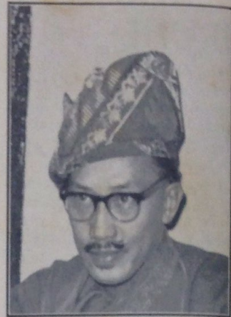
Duli Yang Maha Mulia