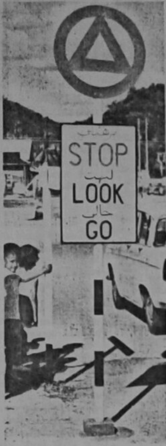
Tanda2 lalu lintas di-jalan2 raya semacham ini dapat di-lihat dalam Negeri Brunei sekerang. Tanda lalu lintas itu ada-lah menggunakan bahasa Melayu (huruf Jawi) dan bahasa Inggeris. Dapat-kah pembaccha meneka di-mana-kah letak-nya tanda lalu lintas tersebut ?