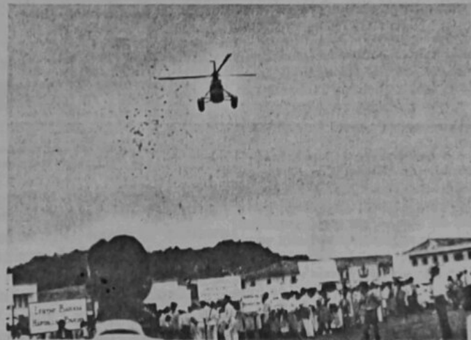
Ini-lah satu peristiwa yang menarik perhatian beribu2 orang yang membanjiri Bandar Brunei pada masa di-adakan pembukaan rasmi rapat umom dan perarakan Bulan Bahasa Kebangsaan pada petang 23 July, 1962. Dalam gambar ini kelihatan sa-buah kapal terbang kepunyaan Sharikat Minyak Shell Brunei Berhad yang telah menggugorkan beribu2 naskah kertas yang berwarna warni mengandongi IKRAR BAHASA.