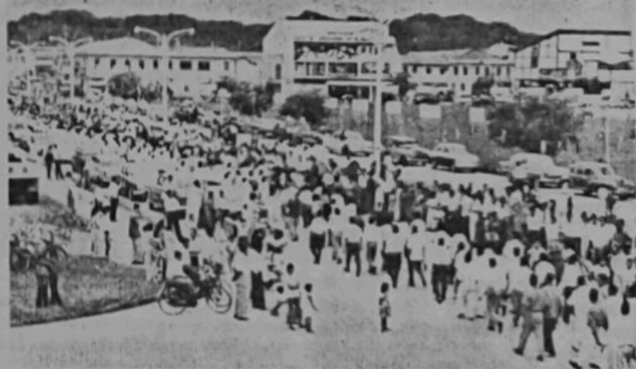
Satu pemandangan perarakan Bulan Bahasa Kebangsaan yang telah di-adakan di-Bandar Brunei pada petang 23 July, 1962.