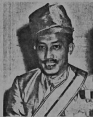
Duli Yang Maha Mulia Maulana Al-Sultan.

"Hasil pekerjaan Surohanjaya ini ada-lah menunjukkan bahawa sa-bahagian kechil orang sahaja yang telah memberikan pendapat-nya dan pada keseluruhannya masing2 ada-lah memberi baya-