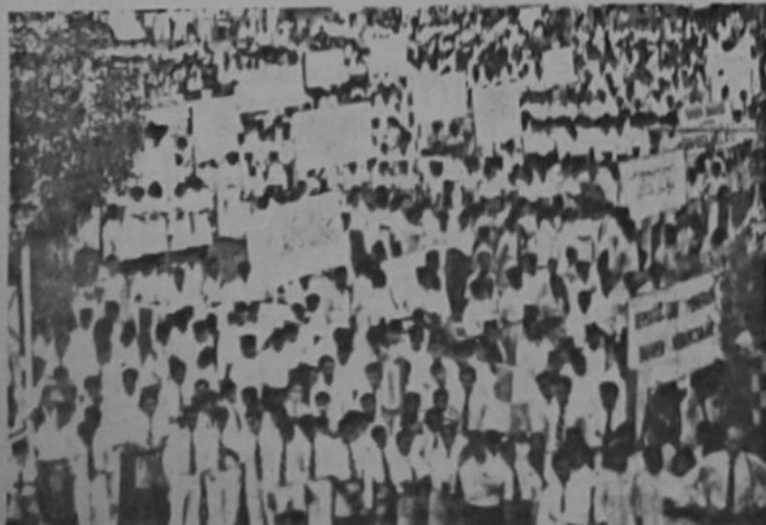
Satu pemandangan di-upacara pembukaan rasmi rapat umum dan perarakan bagi menyambut Bulan Bahasa Kebangsaan yang telah di-adakan di-Bandar Brunei pada 23 July, 1962.

Kebanyakan daripada Ahli2 Majlis Meshuarat Negeri Brunei yang hadir telah memberikan pendapat masing2. Setelah di-undi dengan sa-chara mengangkat tangan, 22 orang telah menyokong usul yang di-kemukakan oleh Yang Amat Berhormat Menteri Besar, 4 orang telah menolak usul itu dan sa-orang ahli telah tidak mengundi.