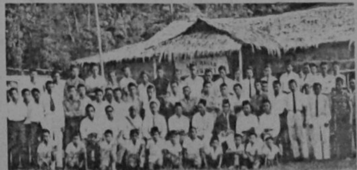
Gambar ramai para hadirin di-majlis menyampaikan Sijil2 Darjah Dewasa yang telah di-langsungkan di-Sekolah Melayu Kati Mahar pada bulan yang lalu.

Majlis itu di-tamatkan dengan bacaan do'a selamat oleh Chegu Ja'afar bin Abbas.