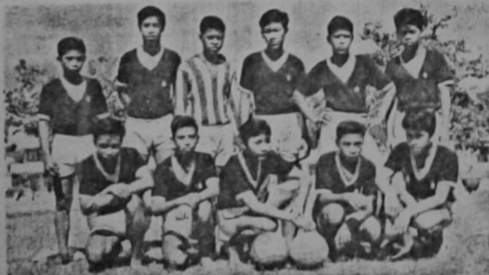
Pasukan Sekolah Melayu S.M.J.A. Bandar Brunei yang telah mengalahkan pasukan Sekolah Melayu S.M.A.T. Kuala Belait dengan 4 gol tidak berbalas dalam perlawanan akhir bola sepak murid2 sekolah sa-negeri ini yang berumur 16 tahun ka-bawah pada bulan yang lalu — Gambar Universal Photo Studio, Brunei.

Semoga usaha yang sa-umpama ini akan terus di-usahakan dengan giat-nya untuk mengisi keperluan2 dalam lapangan pelajaran di-negeri ini.