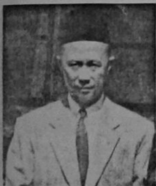
Y.A.B. Dato Setia Marsal