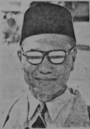
Inche Noordin bin Abdul Latif, Pemangku Pegawai Pelajaran Negara, Brunei.

"Oleh itu harapan ibu bapa kepada guru itu saya nasehatkan kepada kamu bertugas-lah dengan sa-daya upaya supaya tiada menghampakan harapan ibu bapa kanak2 itu," ujar Inche' Noordin.