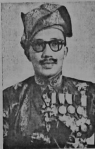
D.Y.M.M. Maulana Al-Sultan

Melalui Radio Brunei pada malam 31 December tahun lalu itu Duli Yang Maha Mulia telah berseru kepada ra'ayat tentang harapan2 dan niat suci Baginda