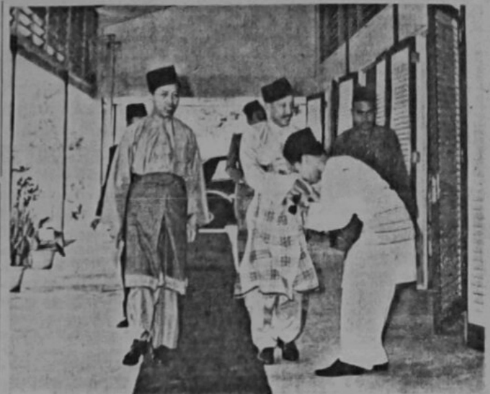
Duli Yang Maha Mulia Maulana Al-Sultan, Sir Omar Ali Saifuddin telah merasmikan pembukaan kursus Ugama di-Maktab Perguruan Melayu Brunei baharu2 ini. Dalam gambar ini kelihatan Duli Yang Maha Mulia di-sambut oleh sa-orang Pegawai Ugama pada mesa Baginda tiba di-dewan Maktab Perguruan Melayu Brunei.