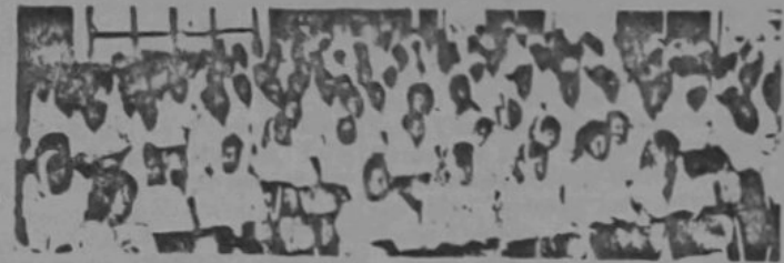
Sa-bahagian dari Guru2 Ugama wanita dan lain-nya kelihatan dalam gambar ini pada masa menghadiri upacara pembukaan rasmi Kursus Ugama oleh Duli Yang Maha Mulia Maulana Al-Sultan di-dewan Maktab Perguruan Melayu

Baginda kemudian-nya mengucapkan tahniah kepada orang2 kampong Keriam atas ketayaan dan kerjasama yang rapat untuk dapat mendirikan sa-buah lagi mesjid yang baharu di-Negeri Brunei.