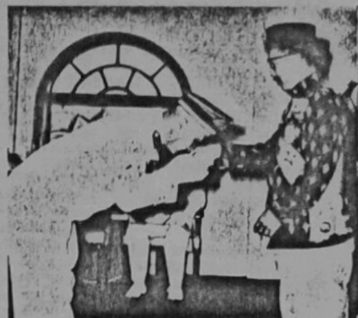
Yang Amat Berhormat Dato Setia Marsal bin Ma'un kelihatan menzierahi Duli Yang Maha Mulia Maulana Al-Sultan sa-lapas menerima kurniaan tauliah lantekan sa-bagai Menteri Besar Brunei, daripada Duli Yang Maha Mulia.

Dato Setia Marsal telah di-istiharkan sa-bagai Menteri Besar Brunei yang telah bersara mulai pada 1 Ogos, 1962.