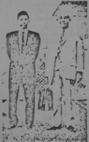
Awang Husin dan Doktor Gould bergambar di-bangunan Lapangan Terbang Brunei sa-belum berlepas ka-Bangkok pada 29 Ogos, 1963.

Persidangan itu telah di-mulai pada 2 September dan di-jangka tamat pada 14 September.