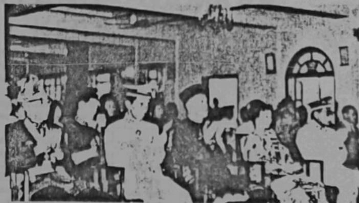
Setu pemandangan para hadhirin di-istiadat mengurniakan tauliah2 lantekan Menteri Besar Brunei dan Setia Usaha Kerajaan Brunei di-Pasiban Agong Istana Darul Hana pada masa do'a selamat sedang di-bachakan.

Seramai 40 pasokan pengakap dari wilayah2 Borneo telah menghadhiri perkhemahan tersebut.