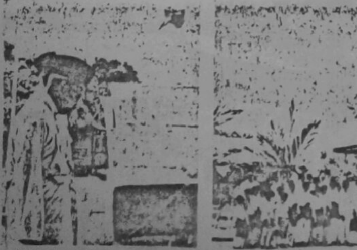
Duli Yang Maha Mulia Maulana Al-Sultan kelihatan di atas sa-buah pentas pada istiadat pembukaan rasmi Mesjid Keriam. Pada masa tersebut murid2 Sekolah Melayu Keriam seopang menggambar ramai orang2 yang hadir di-majlis pembukaan rasmi Mesjid Keriam.