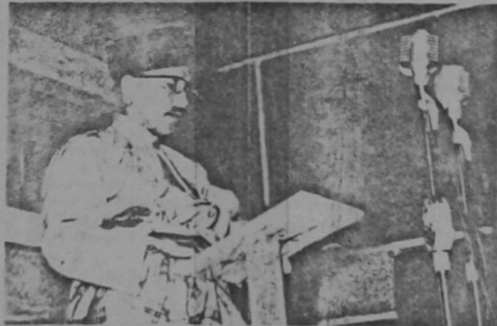
Duli Yang Maha Mulia Maulana Al-Sultan kelihatan bertitah pada masa merasmikan pembukaan kursus ugama baharu2 ini.

BERAKAN — Duli Yang Maha Mulia Seri Paduka Baginda Maulana Al-Sultan telah bertitah bahawa Ugama ia-lah pemimpin