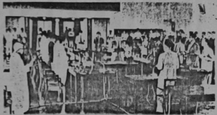
Setu pemandangan Ahli2 Majlis Meshuarat Daerah Brunei yang menang dengan tidak payah bertanding dan Ahli2 Majlis Meshuarat itu yang di-lantik oleh Kerajaan pada masa di-adakan upacara membecha do'a selamat di-Dewan Kemasyarakatan dalam bulan yang lalu.