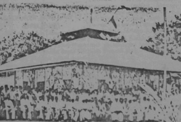
Baginda tiba di-kawasan Mesjid Keriam baharu2 ini untuk melangsungkan pembukaan rasmi. Duli Yang Maha Mulia kelihatan di-tenoah2 gambar ini.