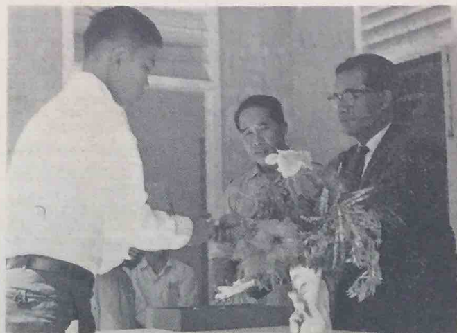
Yang Berhormat Awang Haji Ghazali bin Umar kelihatan dalam gambar ini menyampaikan Sijil kepada sa-orang petani yang telah tamat menghadhiri Kursus Pertanian baharu2 ini.

Oleh itu, Yang Berhormat Awang Haji Ghazali telah menyeru kepada petani2 yang telah tamat menghadhiri kursus pertanian itu, supaya mereka menggunakan pengetahuan mereka, bukan sahaja untuk kepentingan diri mereka sendiri, bahkan untuk meninggikan taraf pertanian dan perusahaan di-kampung2 mereka pada sa-tiap masa.