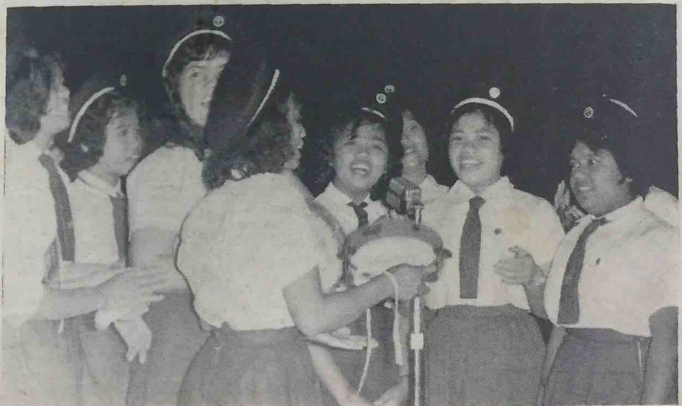
*Kadet2 Puteri dari Maktab Perguruan Melayu Brunei kelihatan dalam gambar ini ashek menyanyi di-temasha Unggun Api Pandu2 Puteri yang telah di-adakan di-pekarangan rumah Pesuruh Jaya Pandu Puteri Negeri Brunei, Yang Teramat Mulia Pengiran Anak Puteri Noor Ehsani baharu2 ini. Lagu apakah yang di-nyanyikan itu? Berita lanjut mengenai temasha Unggun Api tersebut telah di-siarkan dalam akhbar ini pada 4 November, 1964.

Bayaran masuk berlumba ia-lah $1 bagi tiap2 pelumba. Wang itu hendak-lah di-kirimpkan dengan saberapa segera dan tidak