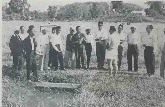
Gambar ini telah di-ambil di-Pusat Perchubaaan Tanam2an di-Kilanas pada masa lawatan Penghulu2 dan Ketua2 Kampong dari Temburong pada pagi 27 Februari, 1964.

Ahli2 dalam rombongan melawat sambil belajar itu menyatakan keazaman mereka untuk menchurahkan kapada anak2 kampung mereka hasil dari lawatan yang julong2 kali di-adakan dan di-kelolakan oleh Pejabat Daerah Temburong.