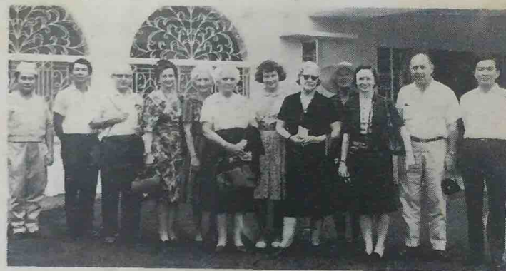
Sa-bilangan pelanchong2 dari Amerika Sharikat bergambar dengan tiga orang yang lain pada masa pelanchong2 tersebut melawat ka-Istana Darul Hana baharu2 ini.

Dalam masa lawatan mereka ka-Negeri Brunei, para pelanchong tersebut telah melawat ka-Istana Darul Hana, Istana Tetamu, Masjid Omar Ali Saifuddin, Kampong Ayer dan ka-lain2 tempat.