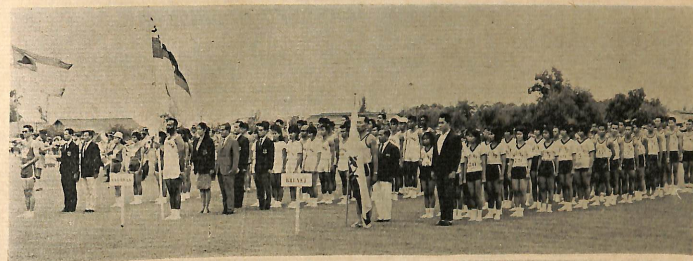
Perserta2 sokan berkumpul sebelum pembukaan perlawanan di-langsungkan.