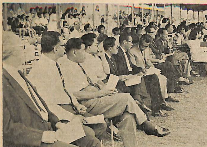
Sa-bahagian daripada orang2 kenamaan yang hadir di-temasha pembukaan Sokan Borneo pada hari Juma'at lepas.

Dalam masa perlawanan2 sokan itu di-adakan baik di-Kuing, Sarawak mahu pun di-Jesselton, Sabah satu perkara yang dapat di-lihat ia-lah hubungan antara ahli2 di-keti-ga2 wilayah itu yang masing2 telah menunjukkan kemeseeraan antara satu sama lain. Hal ini dapat-lah di-buat sa-bagai satu petunjuk bahawa kemeseeraan ada-lah penting bagi mengekal dan mengukuhkan persahabatan dan persafahaman yang sudah terjalin sejak sekian lama itu. Bagitu juga layanan2 yang di-berikan oleh saudara2 kita di-Sabah dan Sarawak sa-masa perlawanan itu di-adakan ditempat mereka ada-lah sangat2 memuaskan. Kita berharap semoga persahabatan itu makin bertambah kukuh lagi.