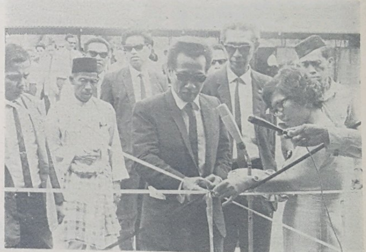
Penulong Menteri Pertanian, Yang Berhormat Pengiran Damit bin Pengiran Sunggoh sedang memotong pita bagi merasmikan pembukaan Hari Peladang yang di-langsungkan di-Sekolah Melayu SMJA, Padang.

Semua barang2 yang di-pamerkan dalam pertunjokkan tersebut, ada-lah untuk di-jual kepada umom tetapi boleh di-bawa pulang hanya sa-lepas tamat-nya pameran itu.