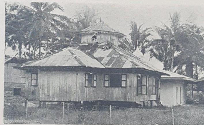
Gambar atas menunjukkan bangunan lama Masjid Sengkurong yang segera akan di-rubuhkan apabila sempurna kerja2 menyiapkan bangunan baru-nya. Ini-lah bangunan masjid yang tertua sekali yang di-bena dalam Daerah Brunei dan Muara. Masjid lama ini telah di-dirikan kira2 40 tahun yang lalu dan perkakas2 pembenaannya ketika itu kebanyakan-nya di-gunakan dari bekas rubohan perkakas2 masjid lama yang di-dirikan di-Kampong Sultan Lama, Bandar Brunei.