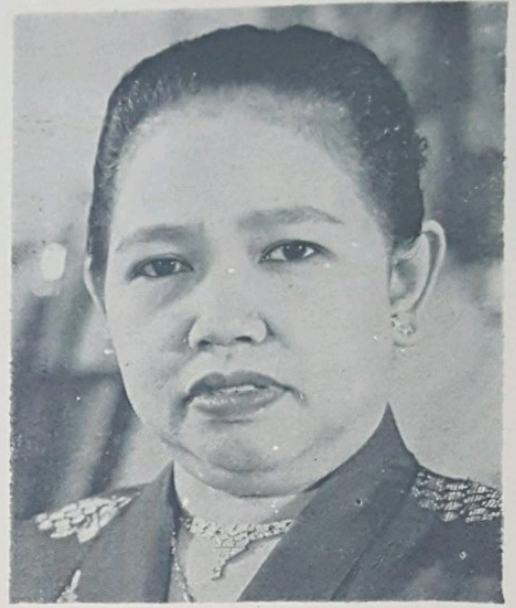
D.Y.M.M. Seri Paduka Baginda Raja Isteri.

SELUROH raayat dan penduduk Negeri Brunei Darus Salam di-sepanjang minggu lalu dan hingga awal bulan Oktober merayakan Hari Ulang Tahun Keputeraan Ka-51 Duli Yang Maha Mulia Paduka Seri Baginda Maulana Al-Sultan ia-itu Sultan yang kasih kepada raayat dan Sultan yang di-kasih raayat.