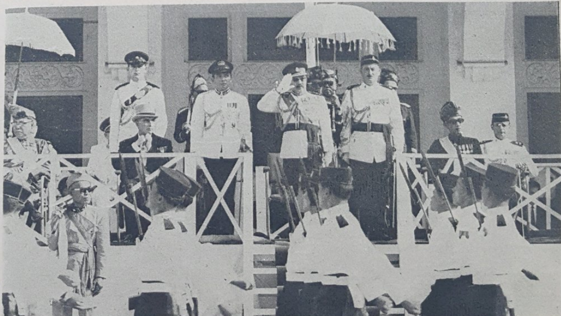
Dalam gambar atas kelihatan Paduka Seri Baginda sedang membalas tabek kehormatan dari atas sa-buah pentas khas.

Yang Teramat Mulia itu di-sertai oleh adinda-nya Yang Teramat Mulia Duli Pengiran Muda Mohamad Bolkiah.