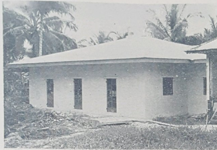
Gambar atas kelihatan bangunan baru Masjid Sengkurong yang sedang dalam kerja2 menyiapkan-nya. Masjid baru ini telah menelan belanja pembenaan-nya sa-banyak $22,000.00.

Pengarah Laut Awang Jack Turner berkata, tambatan Bandar Brunei akan di-jadikan tempat berlangsung-nya perlumbaan perahu dari moto sangkut pada 30 September, dan Pertandingan Perarakan Berchuchol Di-Ayer pada sebelah malam untuk merayakan Hari Keputeraan Duli Yang Maha Mulia Paduka Seri Baginda Maulana Al-Sultan.