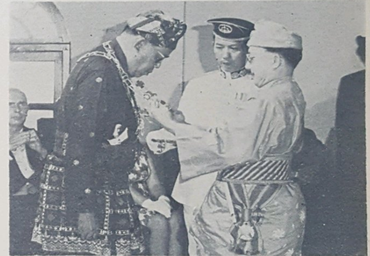
Duli Yang Maha Mulia Paduka Seri Baginda kelihatan dalam gambar atas ketika mengalungkan Bintang Kebesaran, Darjah Kerabat Yang Amat Di-Hormati, Darjah Pertama kepada Yang Teramat Mulia Seri Paduka Duli Pengiran Pemancha.