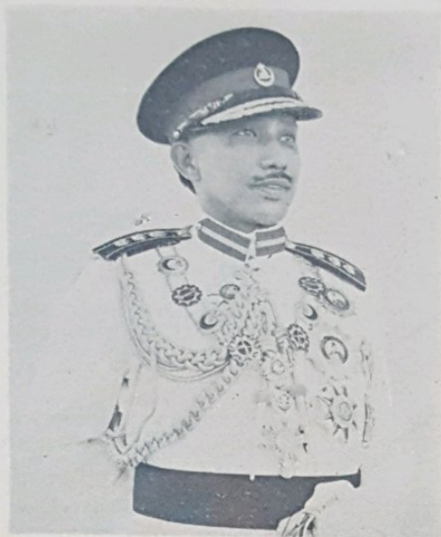
D.Y.M.M. Paduka Seri Baginda Maulana Al-Sultan.