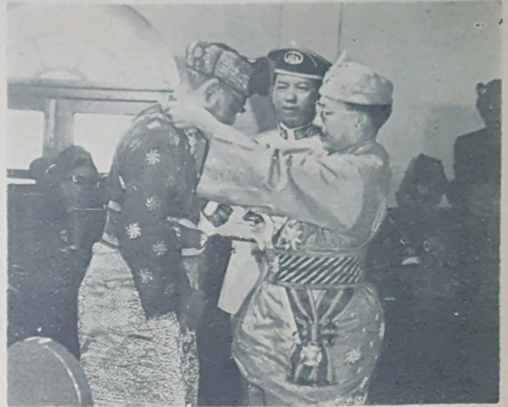
Gambar atas menunjukkan, Duli Yang Maha Mulia Paduka Seri Baginda dalam kerja2 menyiapkan-nya. Masjid baru ini telah memelan besaran, Darjah Kerabat Yang Amat Di-Hormati, Darjah Pertama kepada Yang Teramat Mulia Seri Paduka Duli Pengiran Bendahara.