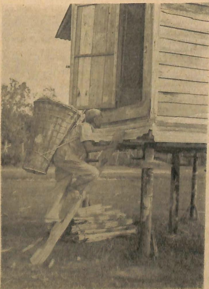
Sa-orang peladang kelihatan "menyikut lasok" yang penuh dengan padi untok di-simpan ka-dalam "dorong".