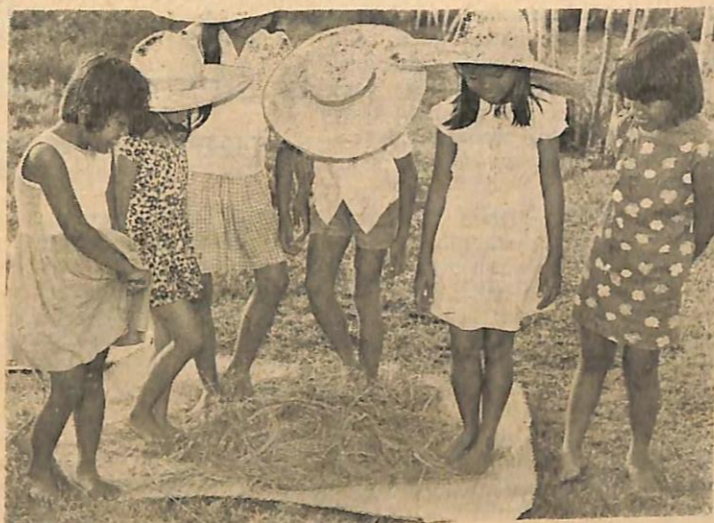
Kanak2 sedang giat turut "mengirek" padi yang kemudiannya akan di-tumbok.