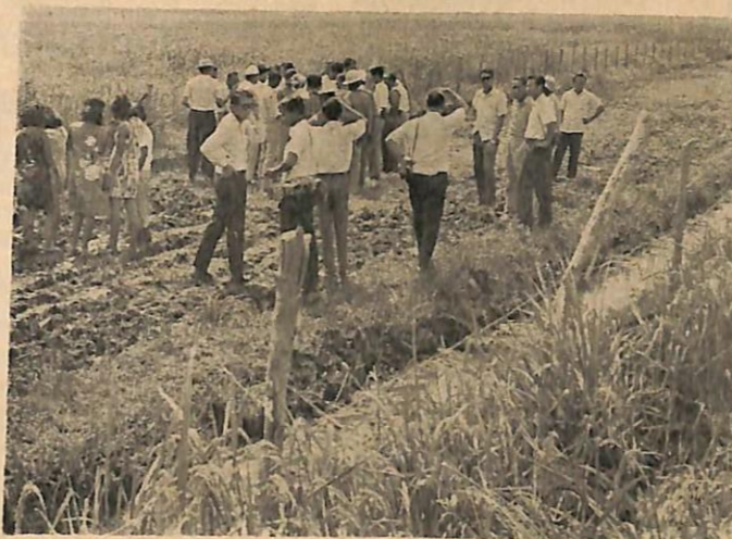
Ladang padi kepunyaan ahli2 Persatuan Peladang Kampong Luagan Dudok telah menarik perhatian peladang2 Kampong Buau, Ulu Belait yang kelihatan sedang mengadakan lawatan ka-ladang tersebut.