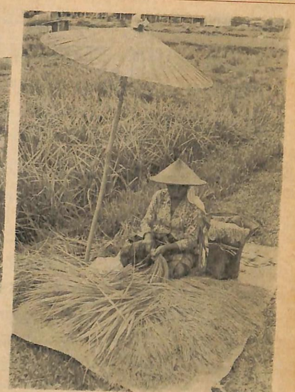
Sa-orang ibu sedang memilih benih2 padi yang akan di-tanam tahun depan. Benih padi yang sedang di-pilih itu ia-lah benih "padi naga".