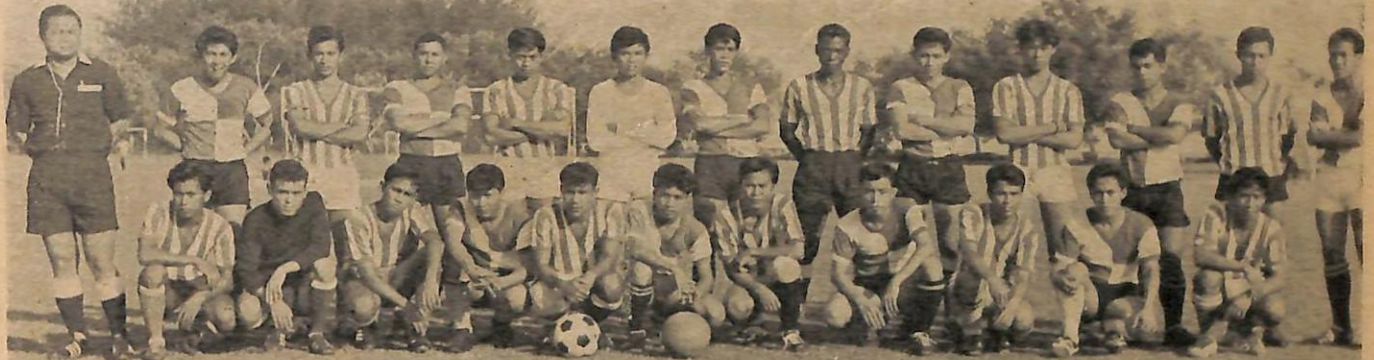
Belia Sumbiling telah mengadakan perlawanan2 bola sepak dengan pasokan belia USNO di-padang Labuan pada minggu lalu. Dalam perlawanan pertama pasokan Sumbiling telah mengatahkan belia USNO dengan 7 gol berbalas dua. Dalam perlawanan kedua mereka telah seri dengan belia USNO 'B'.

Juru Ukor Agong, Awang N.C. Peat menyatakan dukac-hita atas gangguan kepada orang ramai dan pejabat2 kerajaan yang mungkin timbul dalam masa dua minggu itu.