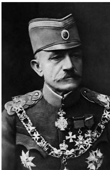
Генерал Живојин Мишић