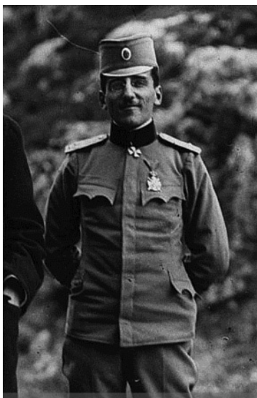
Рејени Александар Карађорђевић