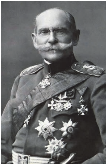
Генерал Павле Јуришић Штурм