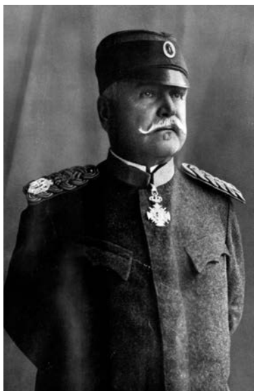
Војвода Сћепа Сћејановић