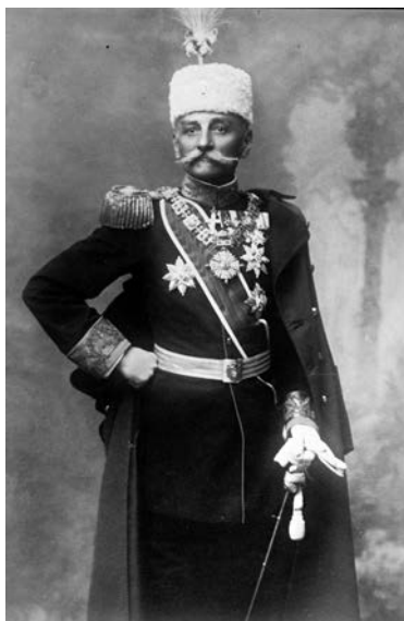
Краљ Петар I Карађорђевић