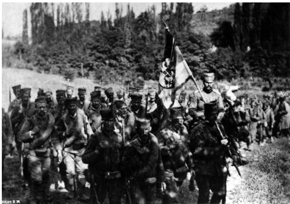
Српска пешадија и српска коњица уочи Церске бијке