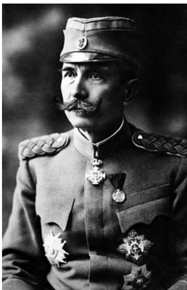
Генерал Петар Бојовић