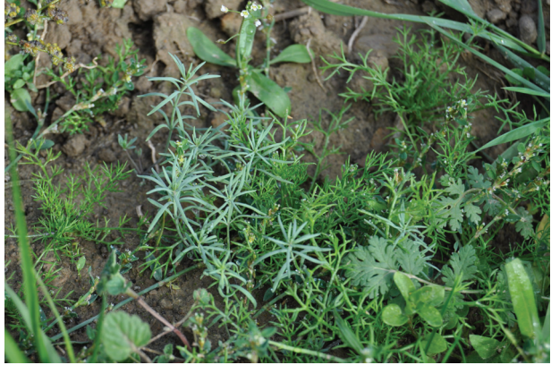
Abb. 4: Jungpflanze des Acker-Leinkrauts mit Chenopodium album, Matricaria recutita, Erodium cicutarium, Thlaspi arvense, Polygonum aviculare, Lamium amplexicaule, Capsella bursa-pastoris und Elymus repens

Ende April und Anfang Mai. Dadurch wird zum einen die Samenbank von Linaria arvensis aktiviert und zum anderen der bereits vorhandene Bewuchs zurückgedrängt. Insbesondere Geruchlose Kamille ( Tripleurospermum perforatum ), Weißer Gänsefuß ( Chenopodium album ), Acker-Hederich ( Raphanus raphanistrum ) und gegebenenfalls Ausfall-Getreide 1 drohen das Acker-Leinkraut in manchen Jahren völlig zu überwachsen. Bei längerer