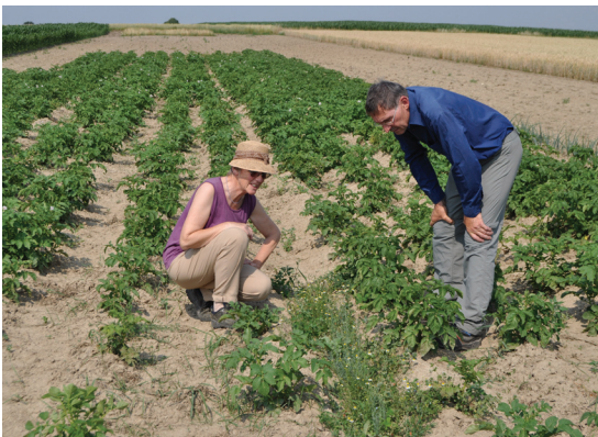
Abb. 7: Kontrolle der Keimerfolge von Linaria arvensis auf dem Osing-Acker

Der Arbeitsaufwand in diesem Freiland-Projekt mit sehr extensivem Kartoffelanbau, der ja speziell an die ökologischen Bedürfnisse der Zielart Linaria arvensis angepasst ist, ist verständlicherweise überdurchschnittlich hoch. Insbesondere der Anteil an Handarbeit, zum Beispiel für das Jäten der Beikräuter und Freistellen der Linaria -Jungpflanzen in mehreren Durchgängen, oder das Absammeln von Kartoffelkäfern (es wird ja nicht