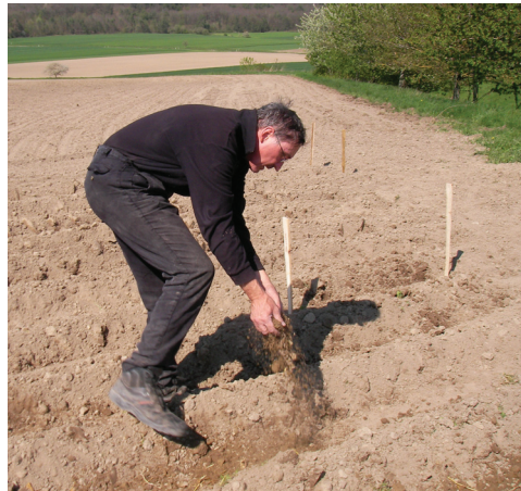
Abb. 6: Anlage der Kartoffelreihen und Ausbringung von Samenbank-Erde vom bestehenden Vorkommen Foto: M. Dotzer-Schmidt, 2.5.2016

Gleichzeitig wurde aber auch Erde mit der Samenbank vom bestehenden Vorkommen zwischen den Kartoffelreihen auf dem Osing-Acker ausgebracht (Abb. 6). Dieses sogenannte „Donor-Samenbank“-Verfahren schlägt auch PÉREZ-LEÓN (2010) im Rahmen einer Diplom-Arbeit über die ‚Entwicklung eines Pflegekonzepts für die vom Aussterben bedrohte Art Linaria arvensis (L.) Desf.‘ vor. Hier konnte ein sehr guter Keimerfolg beobachtet werden. Es scheint demnach am besten, die Samen