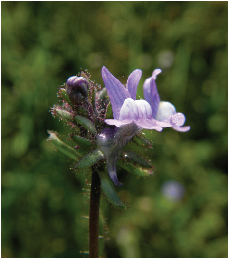
Abb. 1: Blühende Pflanze des Acker-Leinkrauts auf einem Acker westlich Rüdilsbronn

Das Acker-Leinkraut ( Linaria arvensis (L.) Desf., Abb. 1 und 2) ist eine sehr konkurrenzschwache Pflanzenart der Ackerwildkrautgesellschaften, die nach OBERDORFER (2001) selten und unbeständig in lückigen Unkrautfluren vor allem der gehackten Äcker