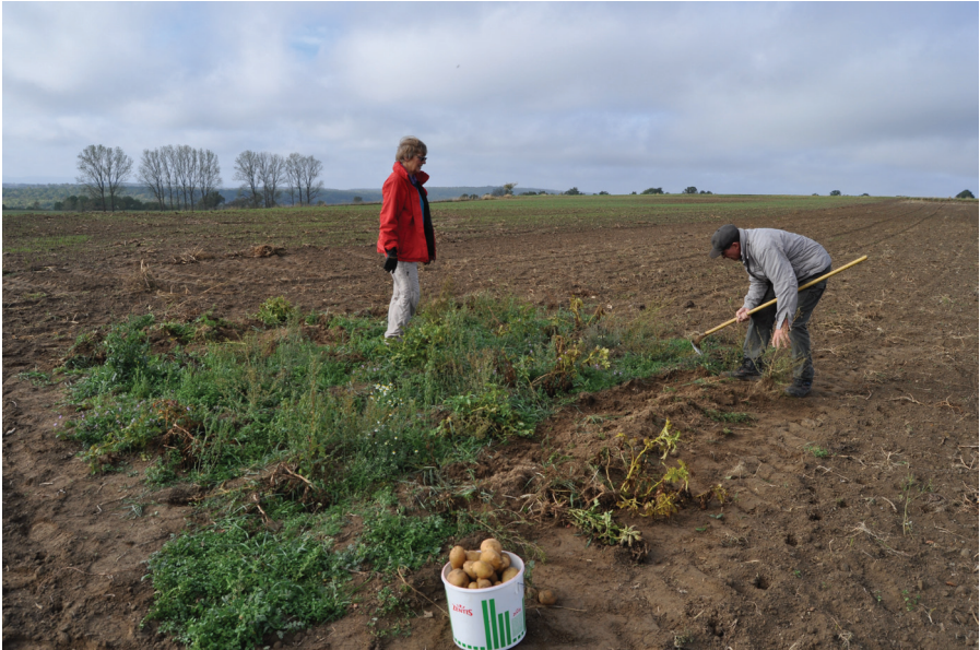
Abb. 8: Restliche Kartoffelernte auf dem Osing-Acker

Misopates orontium , Capsella bursa-pastoris , Chenopodium album , Veronica persica und andere charakterisieren die Wildkrautgesellschaften der Hackfrucht-Äcker der Ordnung Polygono-Chenopodietalia . Einige der in der Tabelle aufgeführten Arten sind Begleiter sowohl auf Getreide- als auch auf Hackfrucht-Äckern , so zum Beispiel Linaria arvensis , Matricaria recutita , Myosurus minimus , Thlaspi arvense , Trifolium arvense und andere. Durch Fruchtwechsel und engen räumlichen Kontakt sind die beiden Gesellschaftstypen aufs engste miteinander verbunden (OBERDORFER 1983).