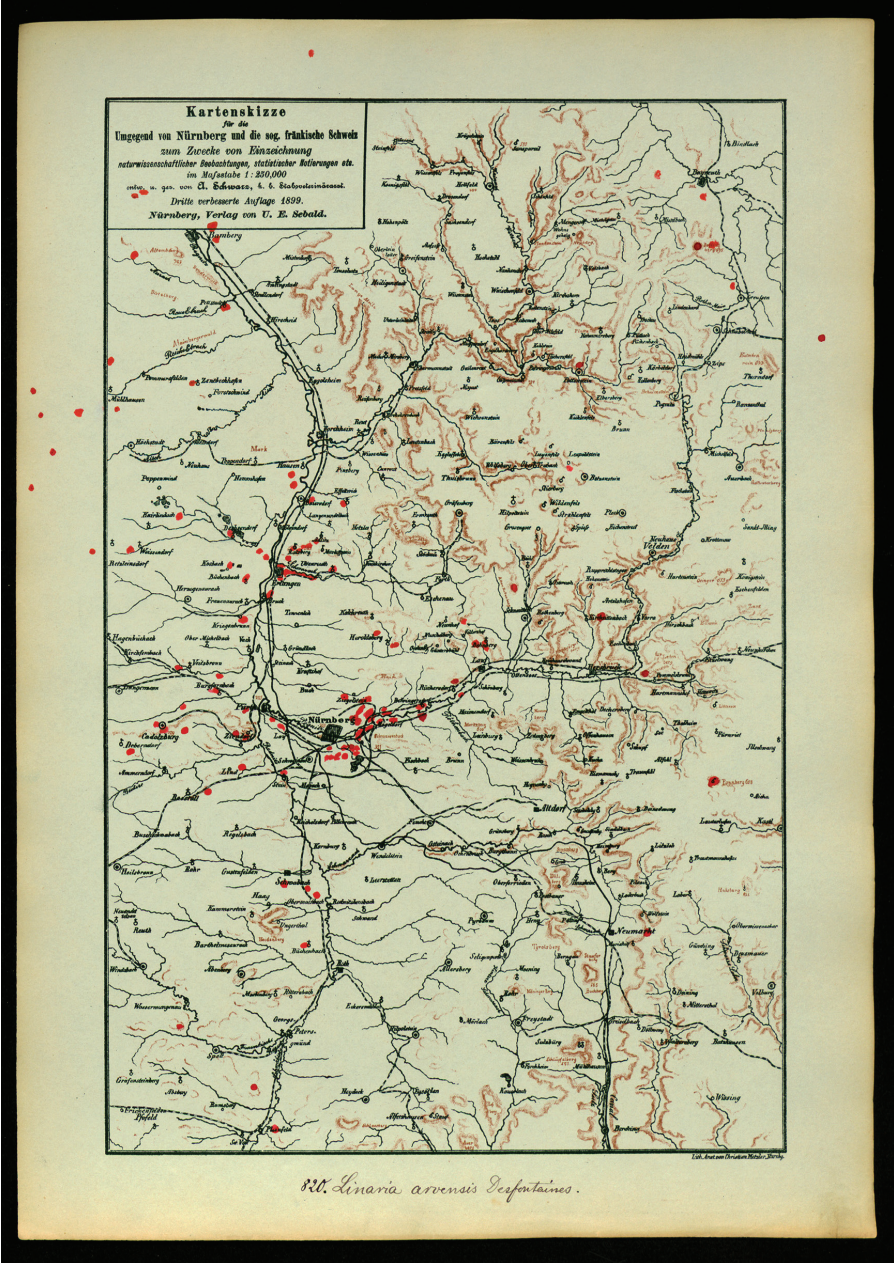
Abb. 3: Verbreitung von Linaria arvensis auf der Schwarz-Gauckler-Karte (SCHWARZ & GAUCKLER, o. J.)