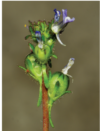
Abb. 2: Fruchtstand des Acker-Leinkrauts