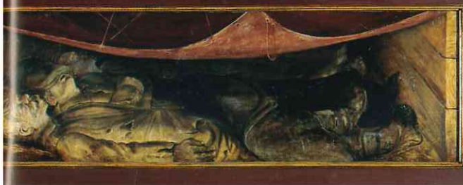
Der Krieg, Triptychon (1929/32; Format: 204 x 408 cm) von Otto Dix (1891 - 1969); Gemäldegalerie, Dresden

und Freude unzähliger Familien ab, das Leben Tausender junger Leute, mit einem Worte, das Glück der